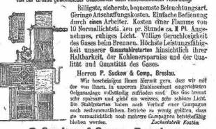
P. Suckow & Comp., Breslau.