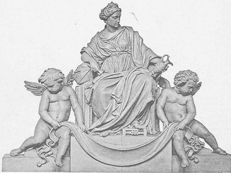
Gruppe auf der Seitenfäçade: Gewerbe mit zwei schwebenden Genien.

Ausgeführt von Ch. Iguel, Bildhauer in Genf.