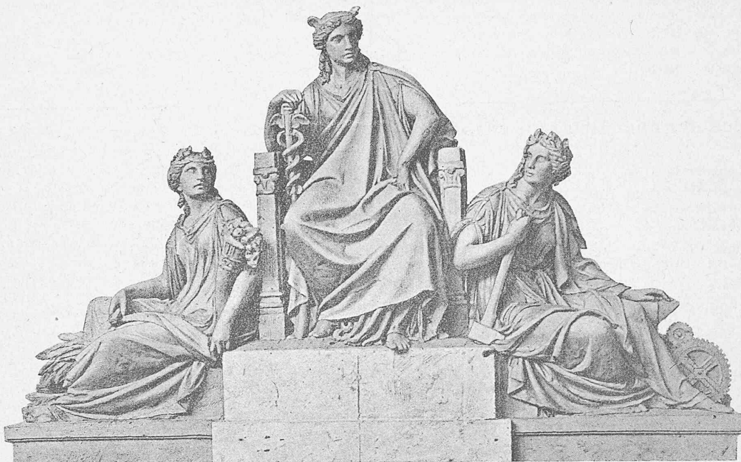
Gruppe auf der Hauptfäçade: Landwirtschaft, Handel und Industrie.

Ausgeführt von Ch. Iguel, Bildhauer in Genf.