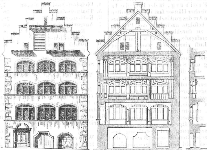
Das Rathaus in Zug.

Eindruck machten, ausgenommen etwa Bern, dessen Anlage von jeher nach einheitlichem Plane normirt gewesen zu sein scheint. Die meisten Städteanlagen zeigten dagegen wahre Strassenlabyrinth, in denen eine entsprechende, chaotische Unordnung herrschte. Unter den Arcaden der Hauptstrasse konnte man Schweinställe antreffen, und in den hintern Gassen wurde gelegentlich das Vieh gehütet. Steinerne Häuser waren zu Anfang des vierzehnten Jahrhunderts, wie uns vielfach verbürgt