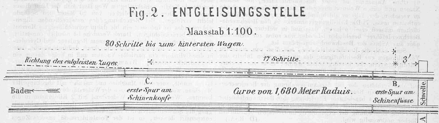
Fig. 2. ENTGLEISUNGSSTELLE Maasstab 1:100. 80 Schritte bis zum hintersten Wagen. 17 Schritte.