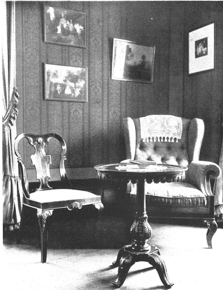
Aus einem Salon in Thun — Von Architekt M. Lutz, Thun

Der Gemeinderat der Stadt Bern hat in seiner Sitzung vom 14. ds. beschlossen, dem Stadtrat die Beteiligung an vier grösseren Wohnbauunternehmungen zu beantragen. Es handelt sich um die Erstellung von zirka 240 Zwei- und Dreizimmerwohnungen mit dem besonderen Zwecke, bei dieser Gelegenheit die immer noch von Notwohnungen belegten Sekundarschulhäuser auf dem Hopfgut und auf der Schosshalde zu räumen.