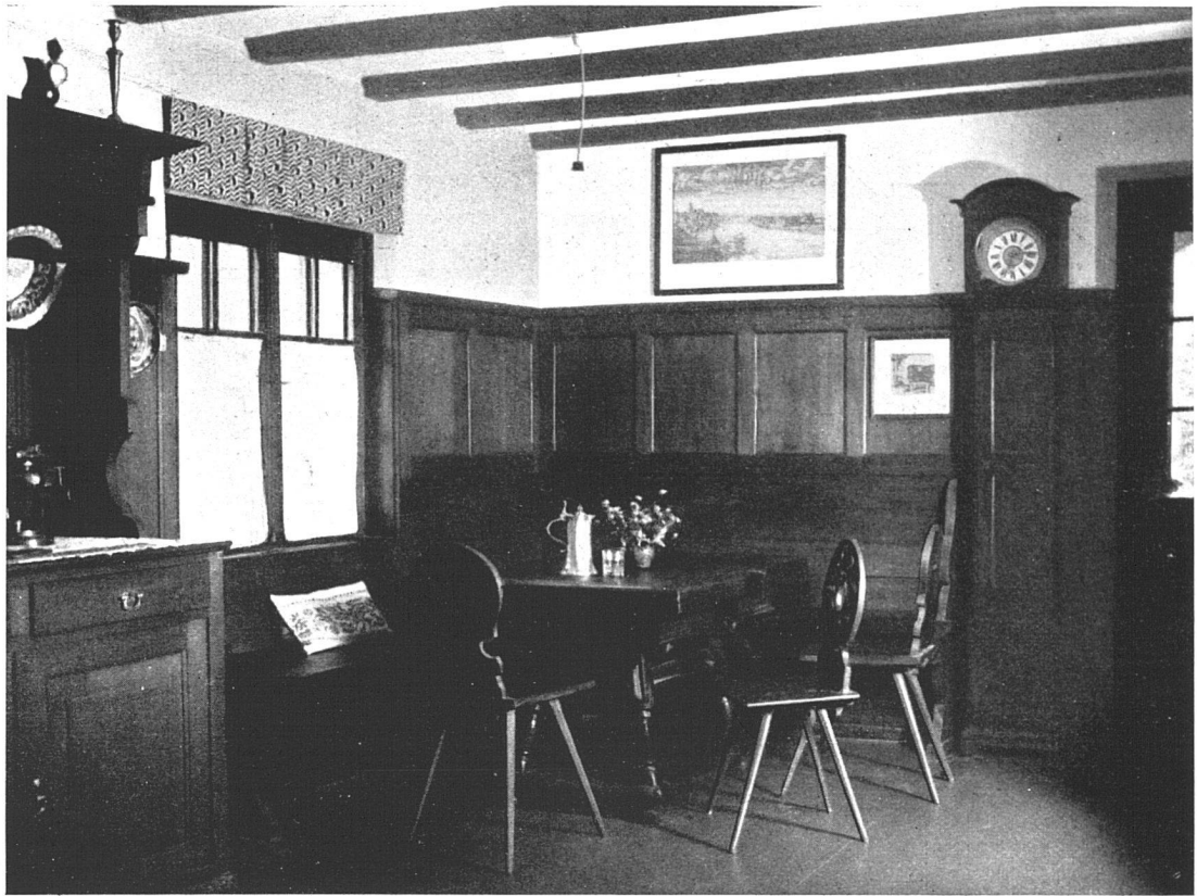
Chalet „Signina“ Flims — Ecke im Ess- und Wohnzimmer — Architekt J. Nold, Felsberg