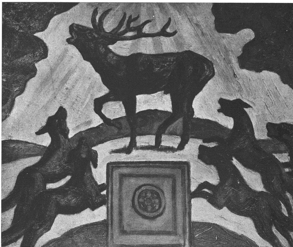
Preisgekrönter Entwurf von P. Altherr, Basel, für die Bemalung des Rosentalbrunnens (Siehe unsern Artikel „Wettbewerb in Basel“)

klassen). Besonderer Wert ist dabei auf die einheitliche, komplette Durcharbeitung des ganzen Baues zu legen. Einfügen in eine bekannte Situation. Kein Phantom! Modelle mit Umgebung.