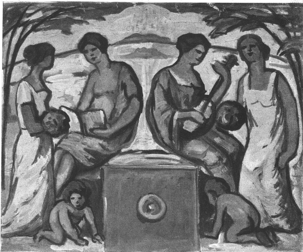
Preisgekrönter Entwurf von P. Altherr, Basel für die Bemalung des Rosentalbrunnens (Siehe unsern Artikel „Wettbewerb in Basel“)

soll — gegen Honorierung — bei Trennung und Differenzierung je nach Neigung und Können bestehen in der 1. künstlerischen Fortbildung in Meisterateliers und Werkstättenarbeit in Sinne Th. Fischers und Pölzigs, 2. Praxis bei Privatarchitekten und Unternehmern, 3. Ausbildung zum Ver-