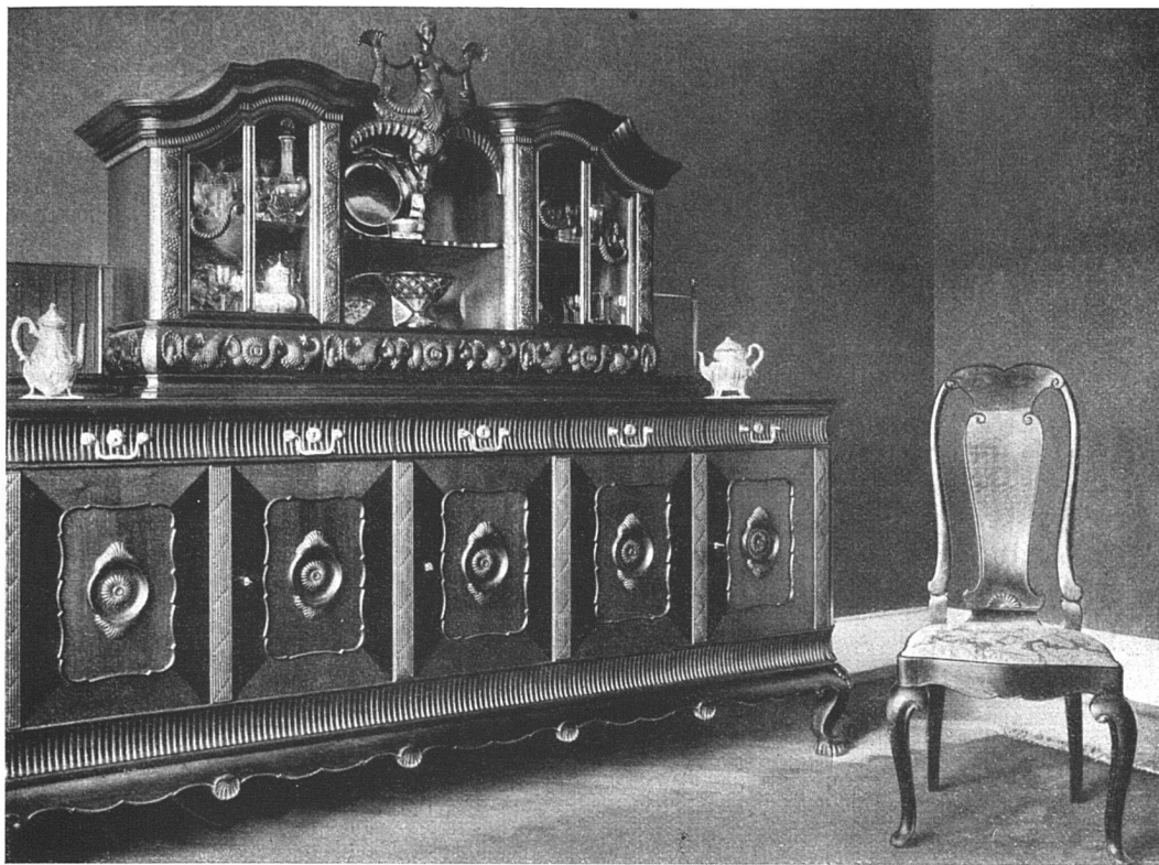
Aus einem Esszimmer in Bern Nussbaumholz gebeizt und gewichst, Tapete und Möbelbezüge roter Damast Von Architekt M. Lutz, Thun