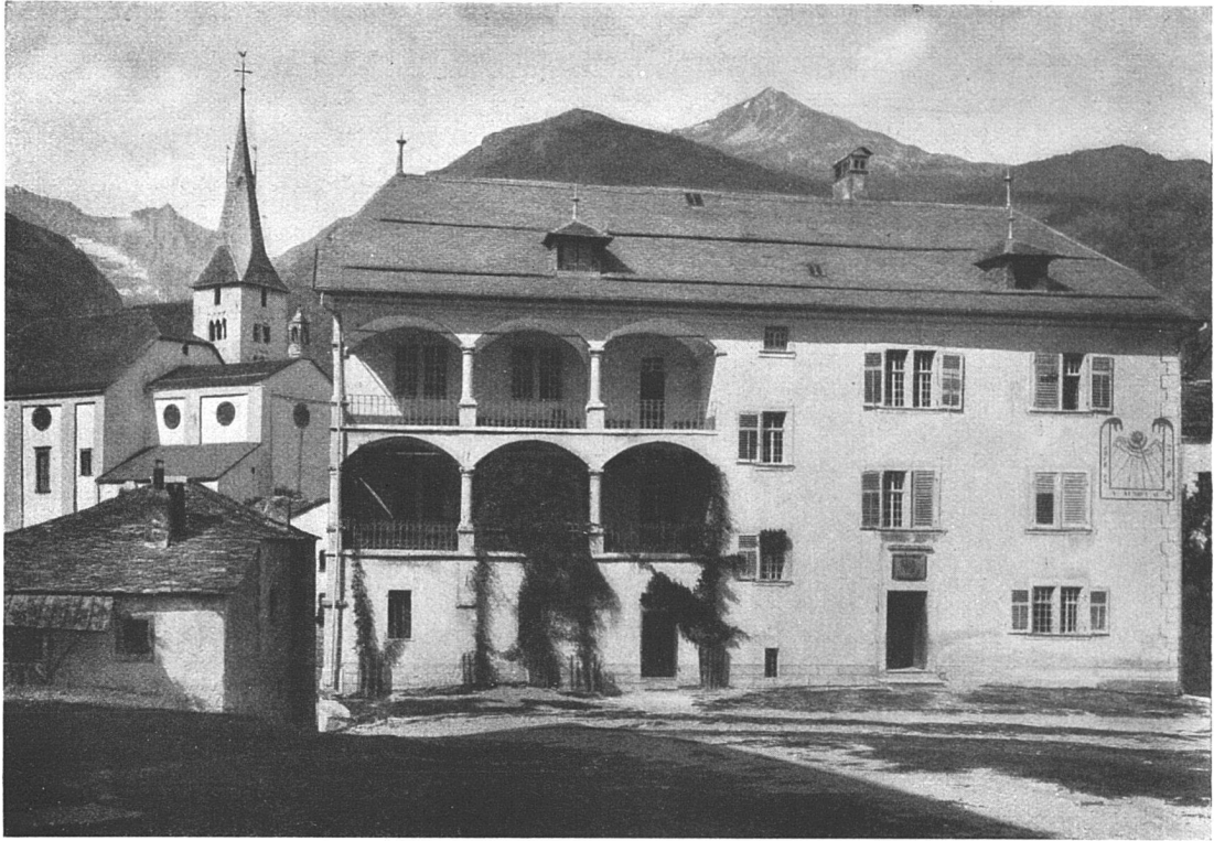
Altes Haus mit Loggien in Viège