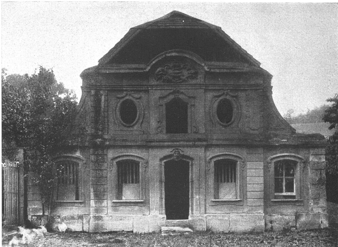
Pavillon im Türlerschen Gut zu Gümligen bei Bern

Auch im Baugewerbe konnte man so ziemlich allgemein die Erscheinung konstatieren, dass die Zeiten der Materialknappheit vorüber sind. Die einzelnen Firmen sind nicht mehr gezwungen, das ganze Rohmaterial für die gangbaren Konstruktionen