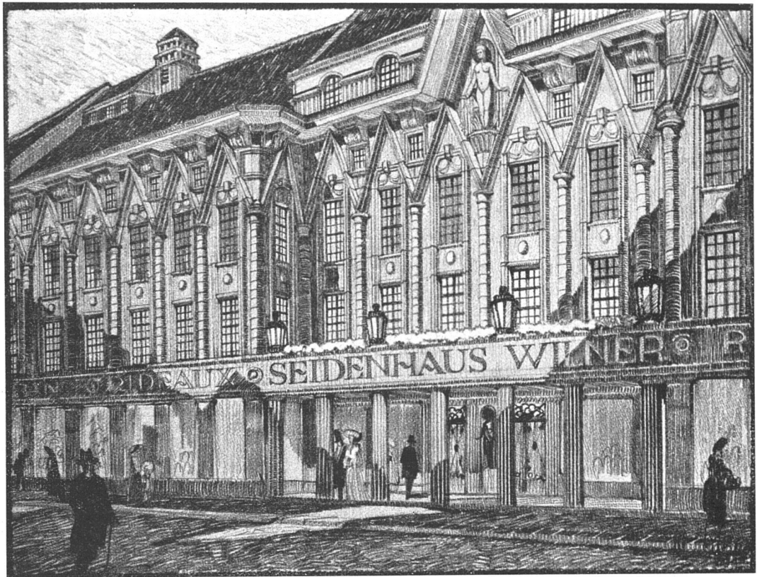
Entwurf zu einem Geschäftshause. — Schaubild. Architekt Maximilian Lutz, Thun.

Strassenfuhrwerken zugänglich. Im Parterre wird man nach der offenen Vorhalle, wo die Eintrittskarten gelöst werden und durch das Vestibul in den grossen Zentralraum gelangen, der durch alle Geschosse hindurchgeht und dem Besucher sofort eine leichte Orientierung ermöglicht. Die Messe-räume sind auf sechs Geschosse verteilt. Sie bedecken insgesamt zirka 30 000 Quadratmeter. Das Parterre ist fast ausschliesslich der Gross-Industrie reserviert, ohne bestimmte Abgrenzung für die einzelnen Ausstellungs-räume. Die übrigen Geschosse sind dagegen in Kabinen eingeteilt und enthalten durchwegs Garderoben, Auskunftsbureaus, zwei bis drei Schreib- und Diktierbureaus, zwei Konversationszimmer, Erfrischungsräume, Telephonkabinen. Die Trennwände zwischen den einzelnen Kabinen werden in einem Einheitsmass hergestellt, um ein rasches Verschwinden zu ermöglichen, derart, dass dem Wunsche der Aussteller Rechnung getragen und einzelne Kabinen leicht verkleinert oder vergrössert werden können. Im eigentlichen Verwaltungsgebäude werden ausser dem Messebureau noch ein Postamt, sowie