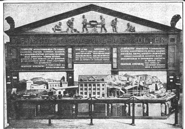
Ed. Binder & Cie., Brienz Atelier für Holzmodelle jeglichen Genres Vielfache Anerkennungen von Staat und Privaten