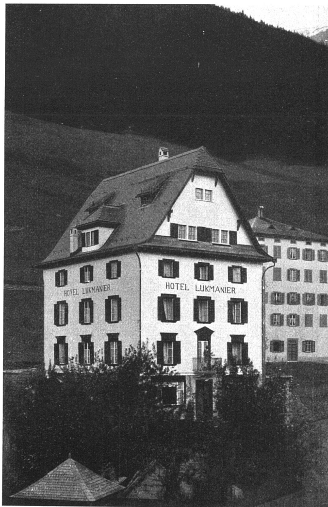
Hotel Lukmanier in Disentis (Hotelaufbau). Architekt: J. Nold, Felsberg (Graubünden).

Bundesbahnen. Der Verwaltungsrat der Schweizerischen Bundesbahnen stimmte in seiner Sitzung