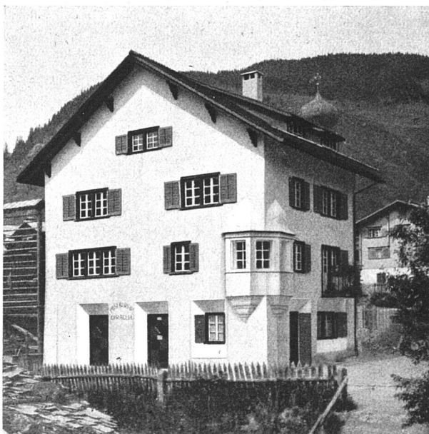
Posta nuova in Medels (Graubünden).

Eine Gartenstadt in Genf. Bei dem von der Fabrik Piccard-Pictet für Pläne zu einer Gartenstadt veranstalteten Wettbewerb erhielt den ersten Preis die Firma Rittmeier & Furrer in Winterthur.