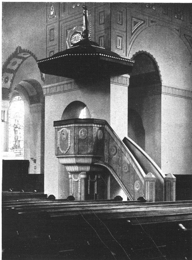
Architekt: Adolf Gaudy, Rorschach.