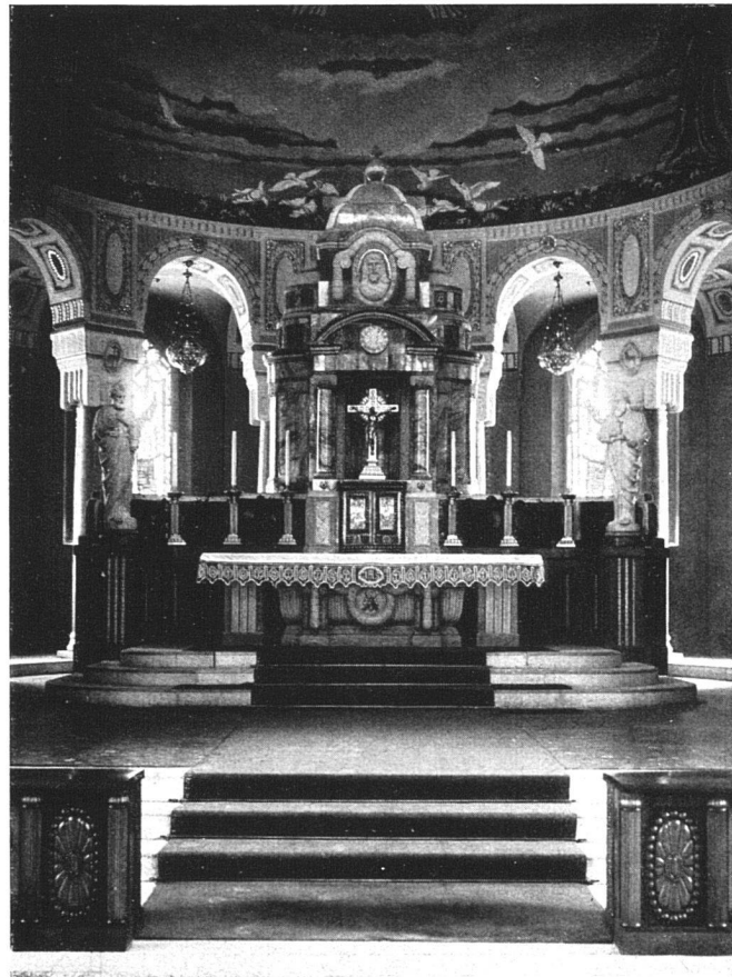
Architekt: Adolf Gaudy, Rorschach.

notwendig, um eine bessere Konzentration der einzelnen Gruppen durchzuführen. Alle geschlossenen Kabinen werden eine Einheitstiefe von 3 m haben; die Höhe beträgt 3 m (statt 2,5 m). Neben diesen organisatorischen Verbesserungen werden auch verschiedene neue administrative Anordnungen getroffen.