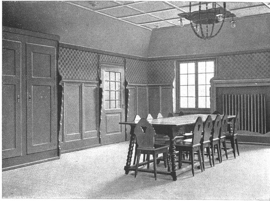
Käserei in Vinelz (Seeland). — Sitzungszimmer und Gemeindelokal. Architekten: Gebr. Louis, Bern.

eine Architektur an und für sich, sondern zugleich um die Erscheinungen ihrer Belebung, vor allem um die Menschengestalten in ihr! Architektur ist Folie des Menschenlebens, aber nur beide Erscheinungen zusammen: das Rahmenwerk und das Füllwerk ergeben in gewissem Sinne den Vollbegriff «Architektur». Die Raumkunst umhüllt das ganze Menschenleben; es handelt sich hier nicht etwa nur um Assoziationen, die aus der Affinität zwischen Bauprogramm und Kunstausdruck entstünden, sondern um eine Wesensverwandtschaft zwischen Lebensgebrauch und Zweckausdruck.