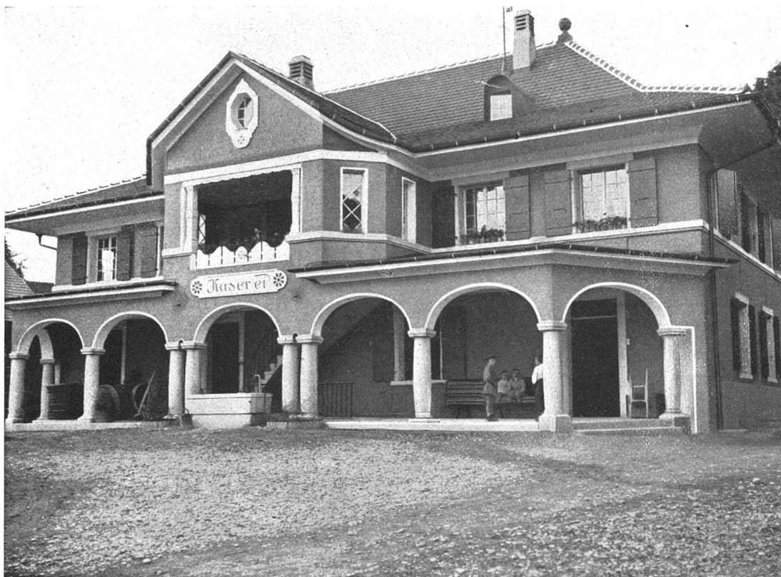
Käseerei in Vinelz (Seeland). — Gesamtansicht. Architekten: Gebr. Louis, Bern.