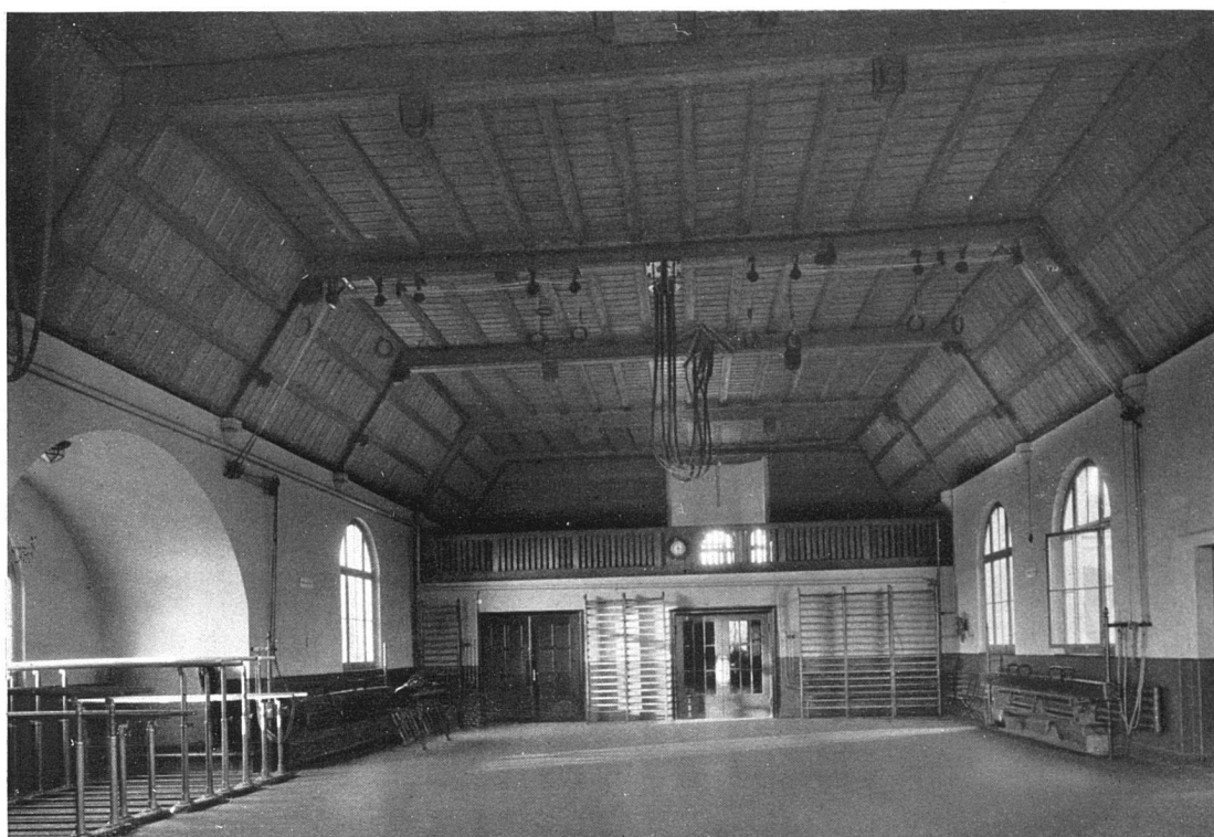
Das Primarschulhaus mit Turnhalle am Hasenbühl für die Schulgemeinde Kirchuster-Winikon-Gschwader. — Blick in die Turnhalle. Architekt Albert Rietmann, Uster.