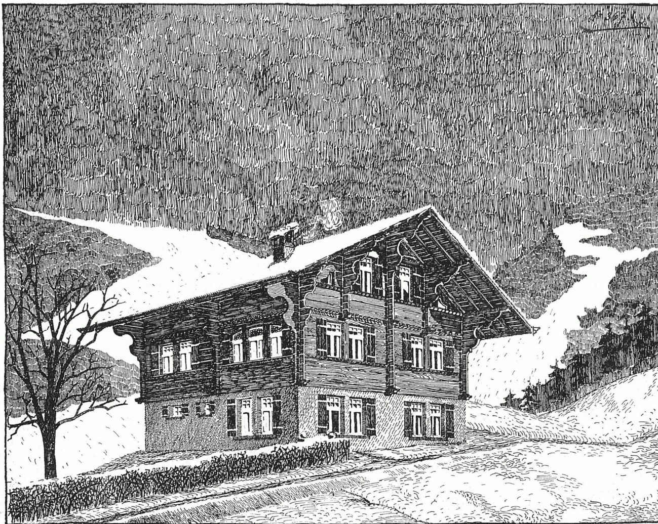
Chalet für Herrn Holzach in Gstaad. Entworfen und ausgeführt von dem Architekturbureau und Baugeschäft v. Grünigen, Reichenbach & Co., Saanen (Kt. Bern).