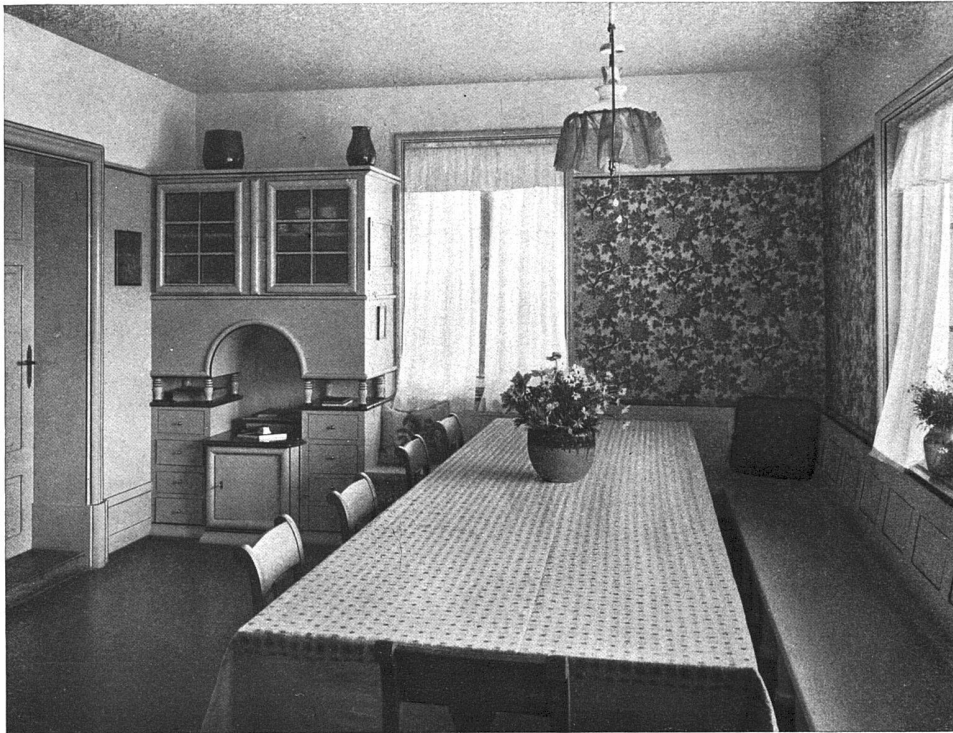
Das Esszimmer im Umbau des «Mütterheims» zu Zürich. Architekt Otto Zollinger, Zürich.

Die Gemeinde Gelterkinden beabsichtigt den Bau einer Uhrenfabrik, die von den Waldenburger Uhrenfabriken mietweise übernommen werden soll. Die