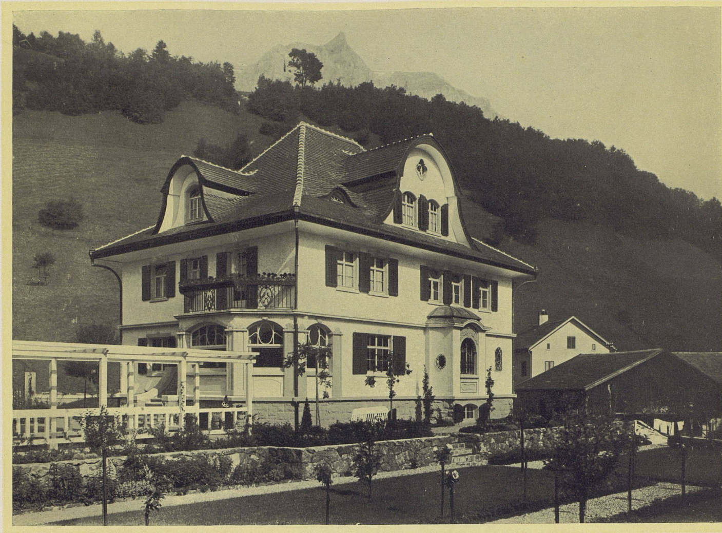
Das Wohnhaus «Eichenhaus» des Herrn Redaktor Rudolf Tschudy zu Glarus. — Die Südfassade. Architekt Fr. Glor-Knobel, Glarus.