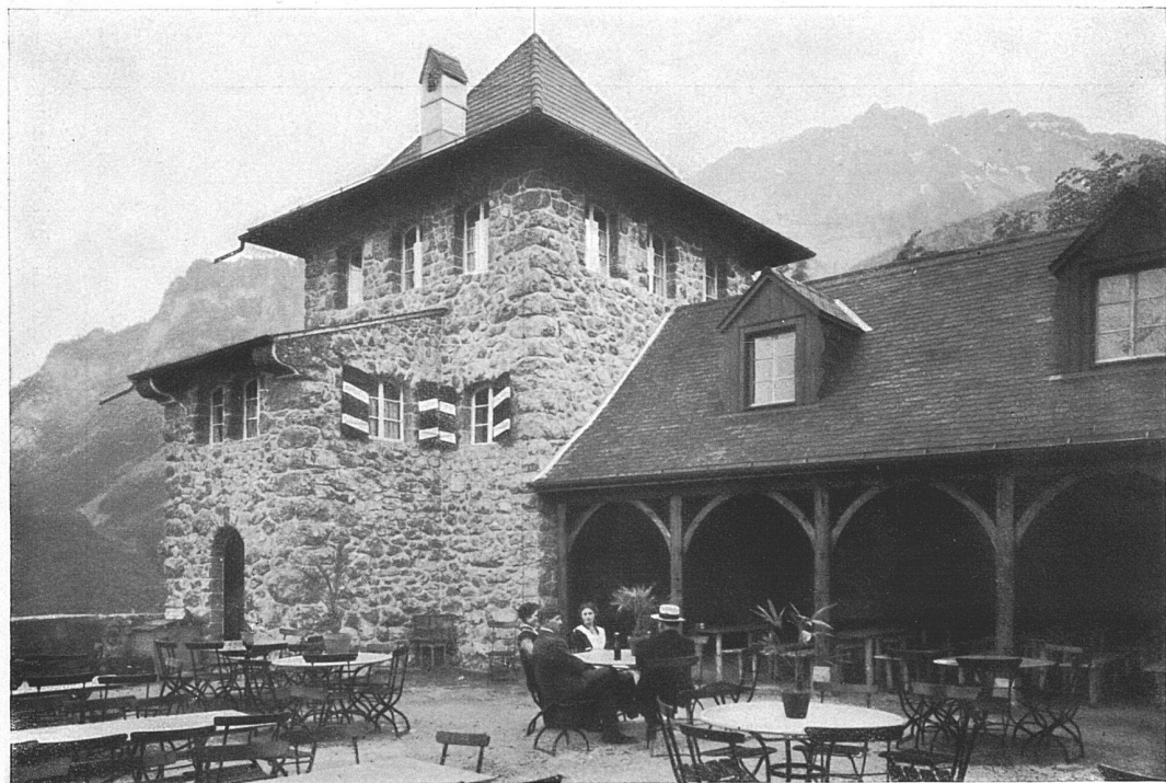
Das «Schössli» bei Niederurnen. — Architekt Fr. Gloor-Knobel, Glarus.