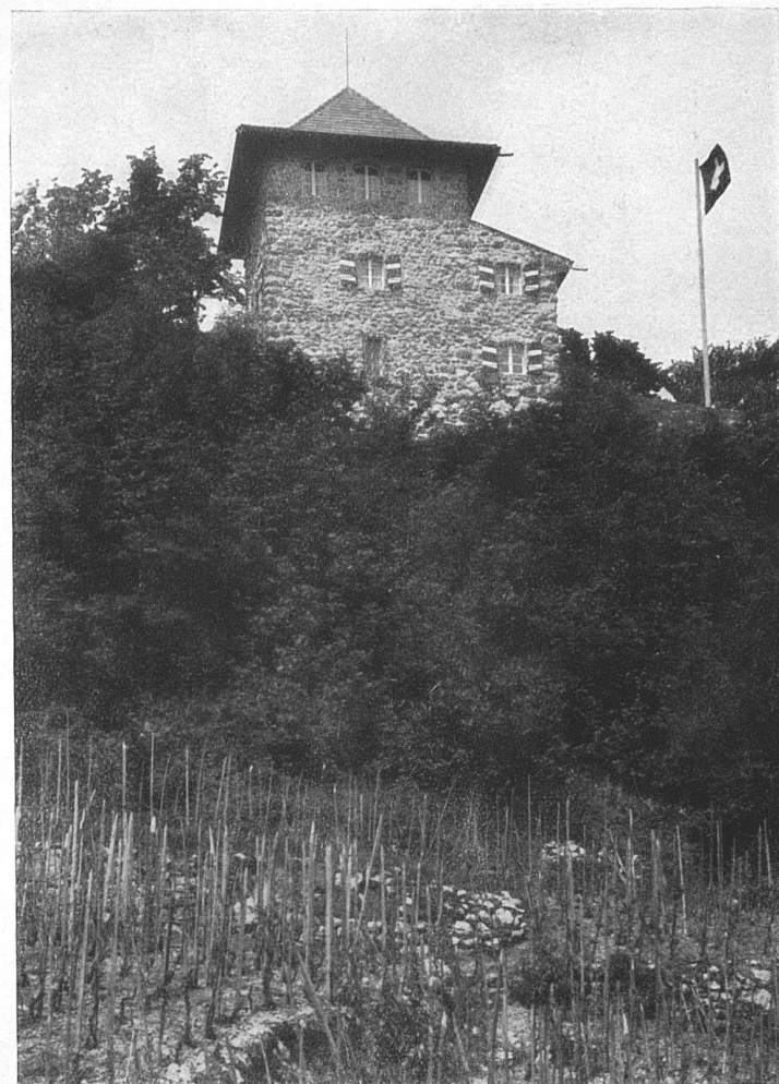
Das «Schlössli» bei Niederurnen. — Architekt Fr. Glor-Knobel, Glarus.