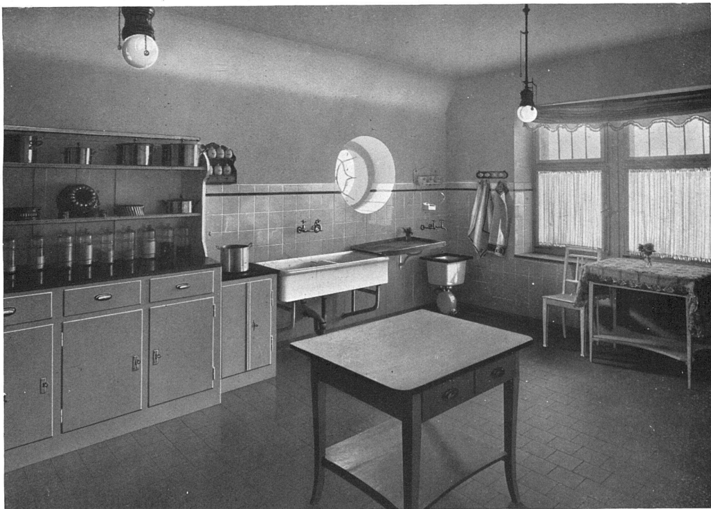
Aus der Küche einer Villa im Rigiquartier zu Zürich. — Architekten Marfort & Merkel, Zürich. Herd für Kohle und Gasbenützung; kombinierbare Warmwasserbereitungsanlage; Feuerton-Spültisch; porzellan-email- lierter Astoria-Ausguss mit Holzrand. Alle Apparate von Bamberger, Leroi & Co., Zürich und Frankfurt a. M. — Installationen von Guggenbuehl & Müller, Zürich.