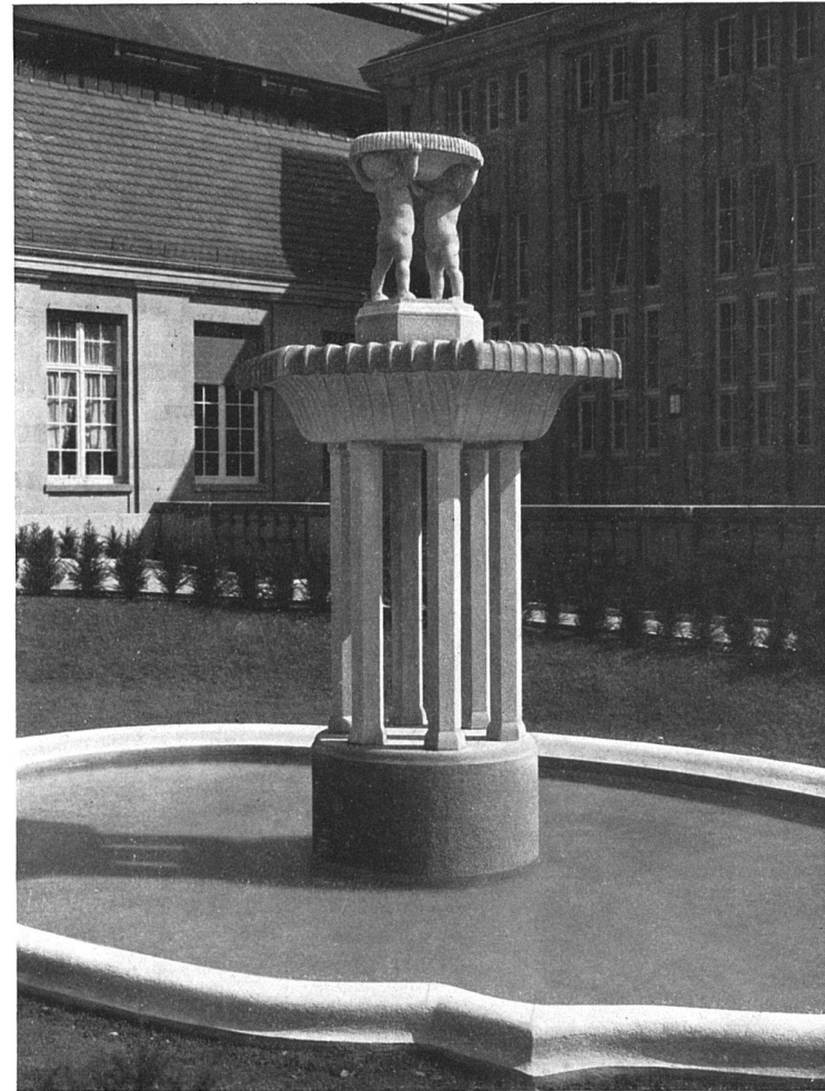
Brunnen im Gartenhof vor dem Fürstenbau. — Entwurf und Modell von Bildhauer Oskar Kiefer, Ettlingen, ausgeführt von G. Schumacher, Haltingen.

Aus dem Aufnahmegebäude des badischen Bahnhofes in Basel. — Architekt Professor Karl Moser (Curjel & Moser), Karlsruhe.