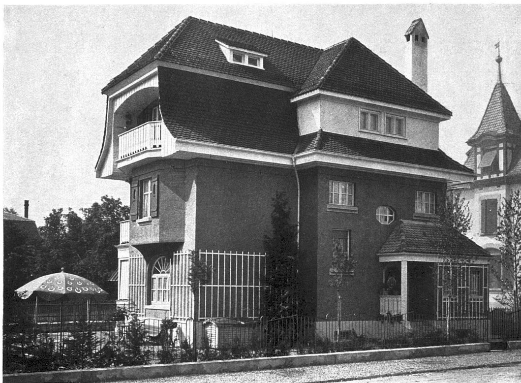
Das Wohnhaus des Herrn W. Kern-Fueter zu Bern, obere Diesbachstrasse. Architekten Nigst & Padel, Bern.