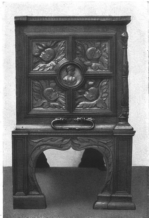
Basler Renaissance-Truhe von 1539. — Die Seitenwände. Im Historischen Museum zu Basel. (Vgl. die Vorderansicht auf der nächsten Seite.)