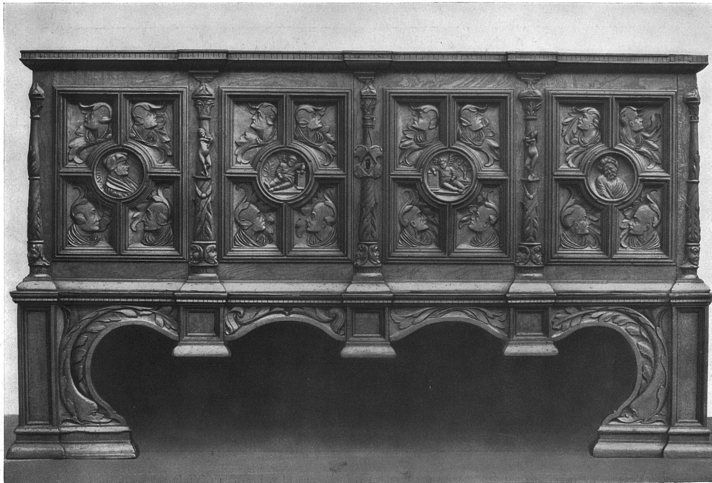
Basler Renaissance-Truhe von 1539. Im Historischen Museum zu Basel.