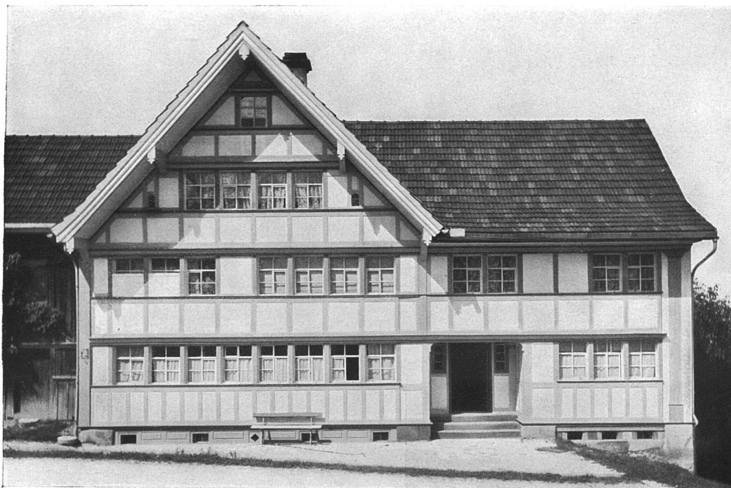
Altes Haus in Hundwil, Kt. Appenzell A.-R.