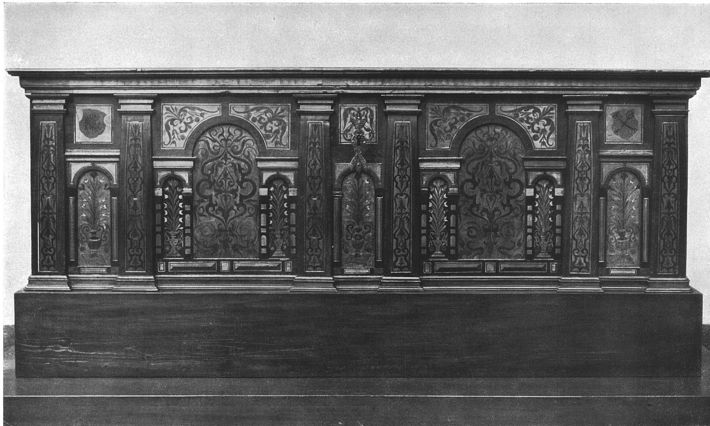
Intarsia-Truhe mit den Wappen der Familien v. Eptingen und v. Ramstein (XVI. Jahrhundert). Im Historischen Museum zu Basel.