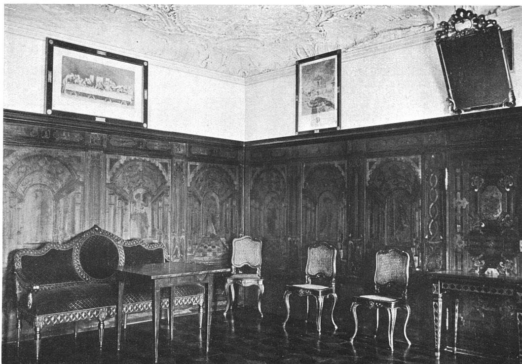
Der Audienzsaal in der ehemaligen Benediktinerabtei Rheinau (Kt. Zürich).