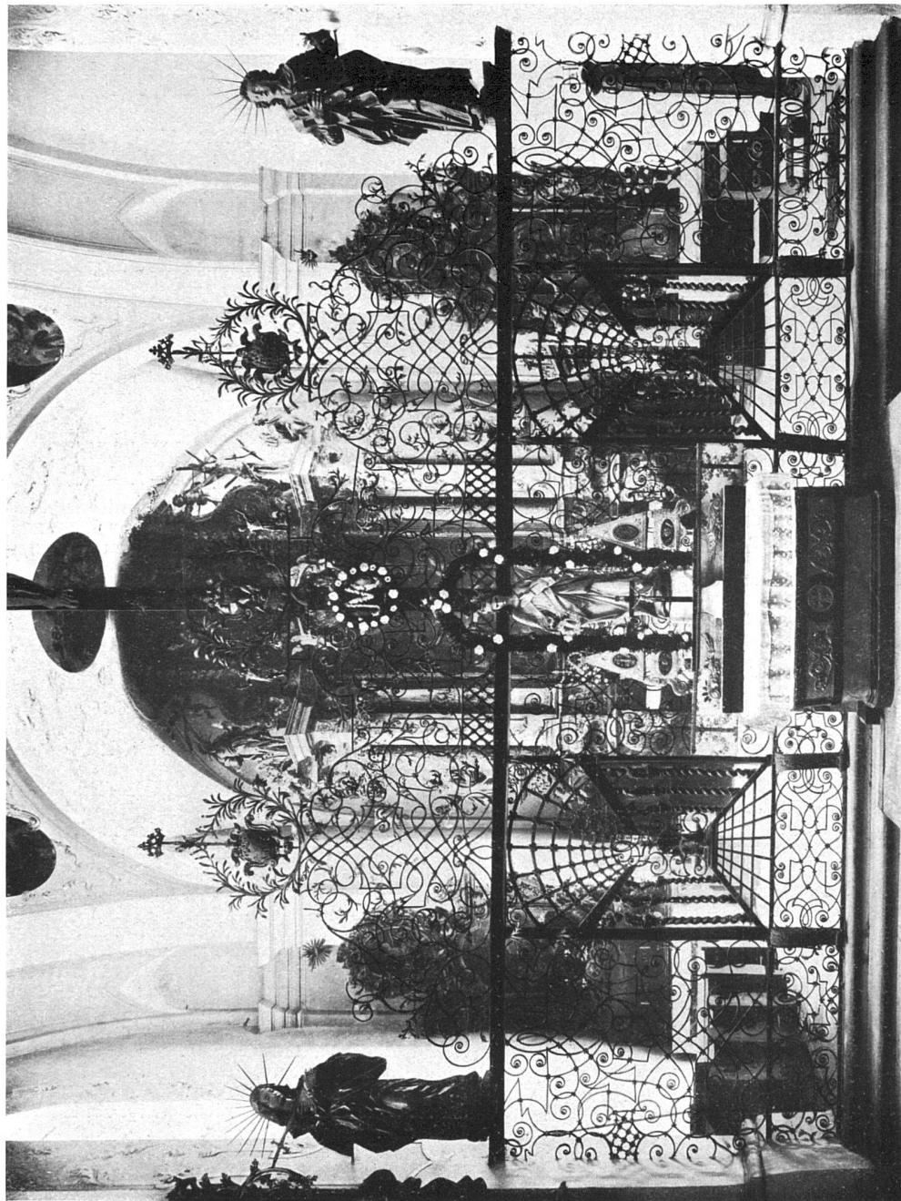
Das Chorgitter in der Kirche des ehemaligen Benediktiner-Frauenklosters zu Münsterlingen (Kt. Thurgau).

von drei bis vier Entwürfen stehen 4000 Fr. zur Verfügung. Die preisgekrönten Arbeiten gehen in den Besitz des Hospices über. Dem Verfasser des ersten Preises wird die Ausarbeitung der Baupläne und die Bauleitung übertragen. Verlangt werden: Ein Lage-