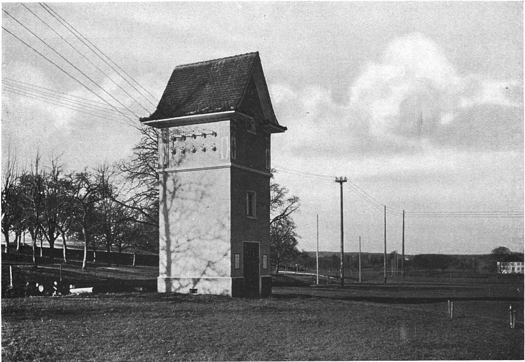
Transformatorenhäuschen bei Waldkirch (Kanton St. Gallen). Ausgeführt vom Kantonsbauamt des Kantons St. Gallen.