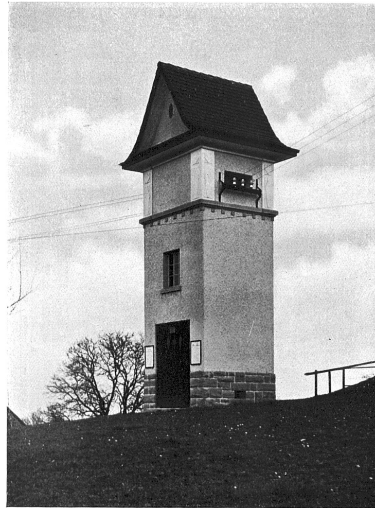
Transformatorhäuschen bei Meggenhusen (Kt. St. Gallen). Ausgeführt vom Kantonsbauamt des Kantons St. Gallen.