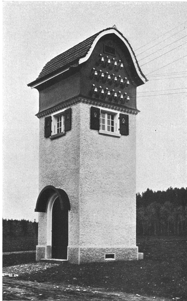
Transformatorhäuschen bei der landwirtschaftlichen Winterschule zu Münsingen. F. u. H. Könitzer, Architekten, Worb.