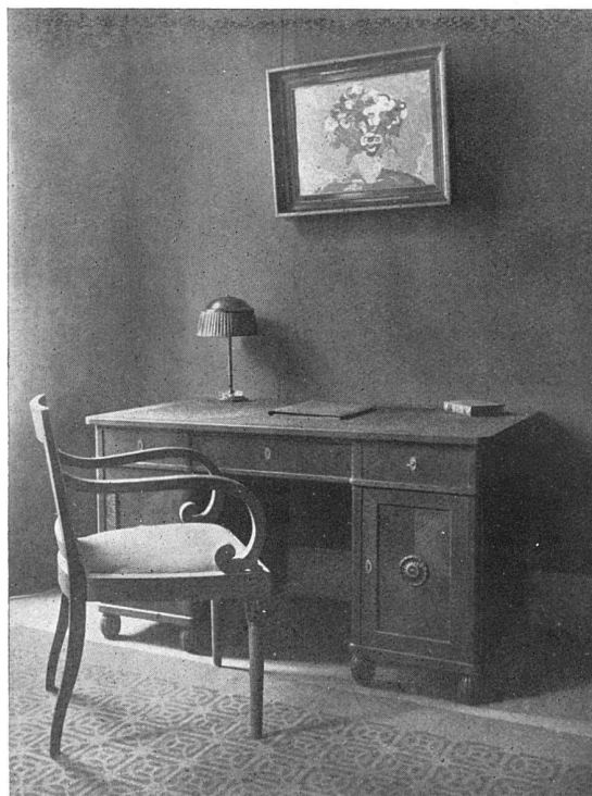
Raum VI :: Herrenzimmer

wahrt. Als diese einem wild sich gebärdenden Subjektivismus weichen mußte, da brach die furchtbare Zeit herein, in der die herrschende Unkultur nicht mehr gut zu machende Sünden auf sich lud. Die baugewandten Techniker setzten ihre angewandten Stillehren, ihre Launen oder gar ihre Schablonen überall hin. Kein Dorf, keine Stadt, die nicht heute an dem verflochtenen Jahrhundert krankte. Mit einer haarsträubenden Gewissenlosigkeit wurde der einmal ausprobierte Plan heute in einem Bergdorf, morgen in einer Vorstadt, übermorgen an einem weichen Seeufer in Stein verewigt. Die schönsten Gegenden, die intimsten Städte und Dörfer in denen früher mit liebe-