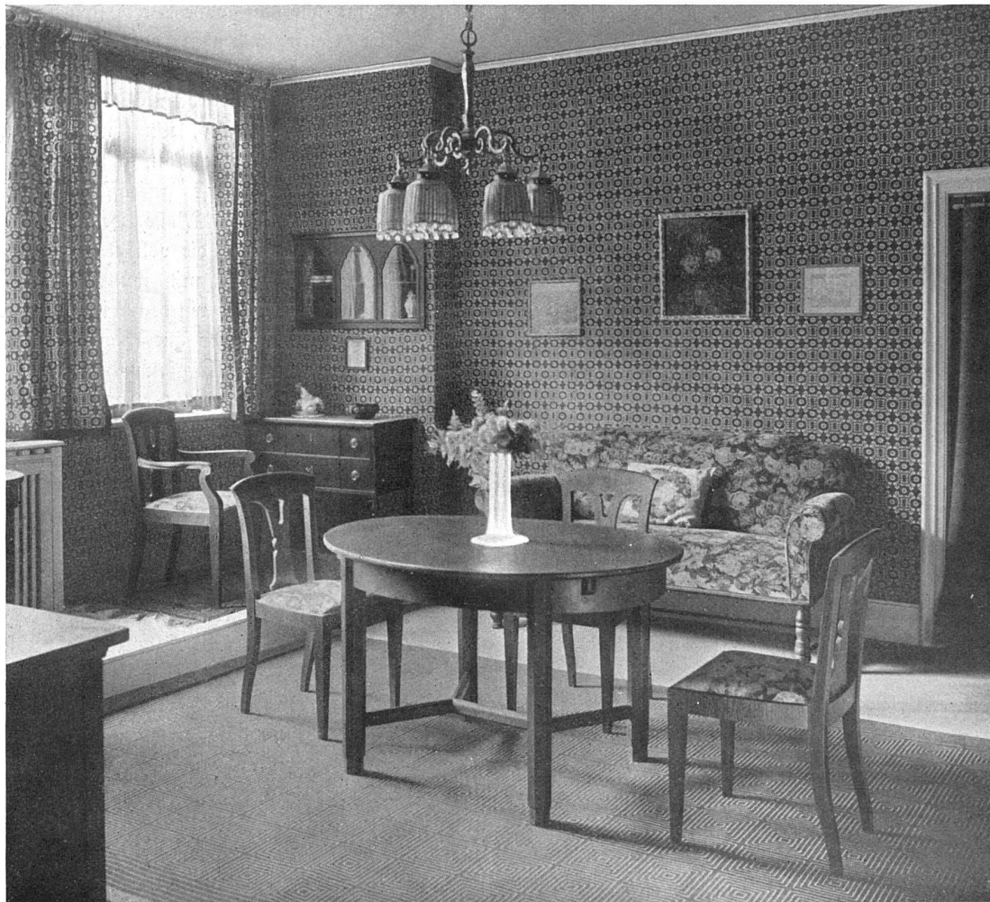
Raum V :: :: Wohn- und Speisezimmer

wir freudig begrüßen, aber es kann noch lange Jahrzehnte dauern, ehe wir wieder zu jenem Ziele gelangen, wo man an ein Unterscheiden der beiden Begriffe Kunst und Kultur nicht mehr denkt. Ein langes trostloses Jahrhundert hat diese Trennung bewirkt, ein Jahrhundert in dem die ganz seltenen Ausnahmen nur die Regel bestätigen. Da hat man das höchste Ziel der Baukunst in der Baufertigkeit erblickt, man orientierte sich emsig aus dicken Stilformenbüchern über das was andere geschaffen haben, man ahnte bald den bald jenen Stil möglichst getreu nach und glaubte damit das Vorbild nicht nur erreicht, sondern mit Hilfe der neuen technischen Mittel übertroffen. Man studierte die Werke der Alten aus trockenen Kompendien und vergaß darüber ihr Dasein als lebendige Organismen, als Kunstwerke, die nicht mit Grundrissen und Buchstaben zu fassen sind, sondern die in ihrer lebendigen Wesenheit mit ihrem Stimmungsgehalt und als Ausdruck einer schöpferischen Persönlichkeit erkannt werden müssen. Man gefiel sich in den tollsten Transplantationen und wunderte sich,