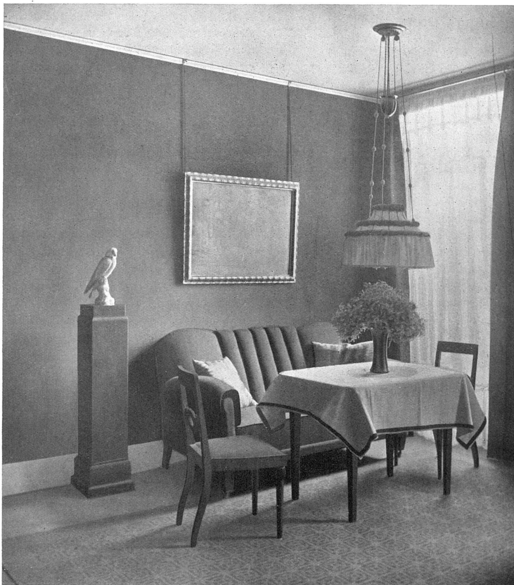
Raum VI :: Herrenzimmer

Grau gebeiztes Eichenholz. Möbelbezüge grün- schwarzer Nips. Wand und Gardinen gelber Nips