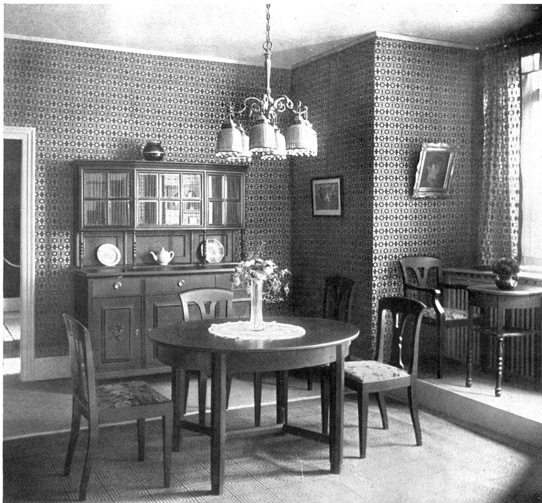
Raum V :: :: Wohn- und Speisezimmer

nicht betätigen erlernten Könnens ist, sondern schöpferisches Raumgestalten. Man darf selbstverständlich dem Architekten nicht einen Vorwurf daraus machen, daß ihm dies viel schwerer fällt als den andern Künstlern. Er ist nicht allein verantwortlich für den langsamen Fortgang dieser neuen Strömung. Er ist selten, fast nie selbstherrlich in seinem Gestalten. Das Bauen ist fast ausnahmslos ein Zusammenschaffen von Architekt und Bauherr — und der Bauherr ist wieder ein Konglomerat von subjektiven Wünschen, Geldmitteln und hundert andern schwer ins Gewicht fallenden Faktoren — der Architekt hat tausend Rücksichten zu nehmen, die der andere frei schaffende Künstler nur nebensächlich zu berücksichtigen hat. Es handelt sich vor allem auch darum, dieses Gefühl einer Baukultur auch dem Bauherrn das heißt der Allgemeinheit beizubringen und hier werden die Schwierigkeiten, die bei den Architekten relativ leicht zu heben sind, ins Unermessene wachsen. Was haben die Renaissancekünstler für eine Kultur als Nährboden gehabt und wie befruchtend hat dieses Zusammen-