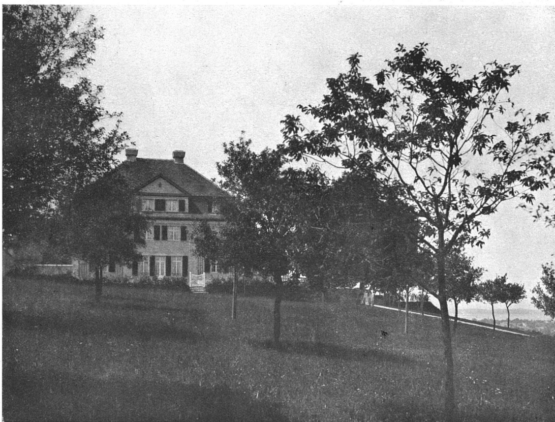
Ansicht vom Garten

Landhaus bei Tägerwilen :: am Untersee (Kt. Thurgau)