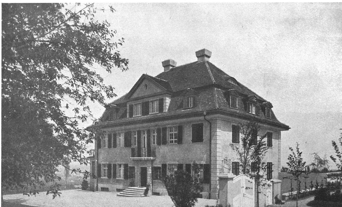
Ansicht mit Haupteingang