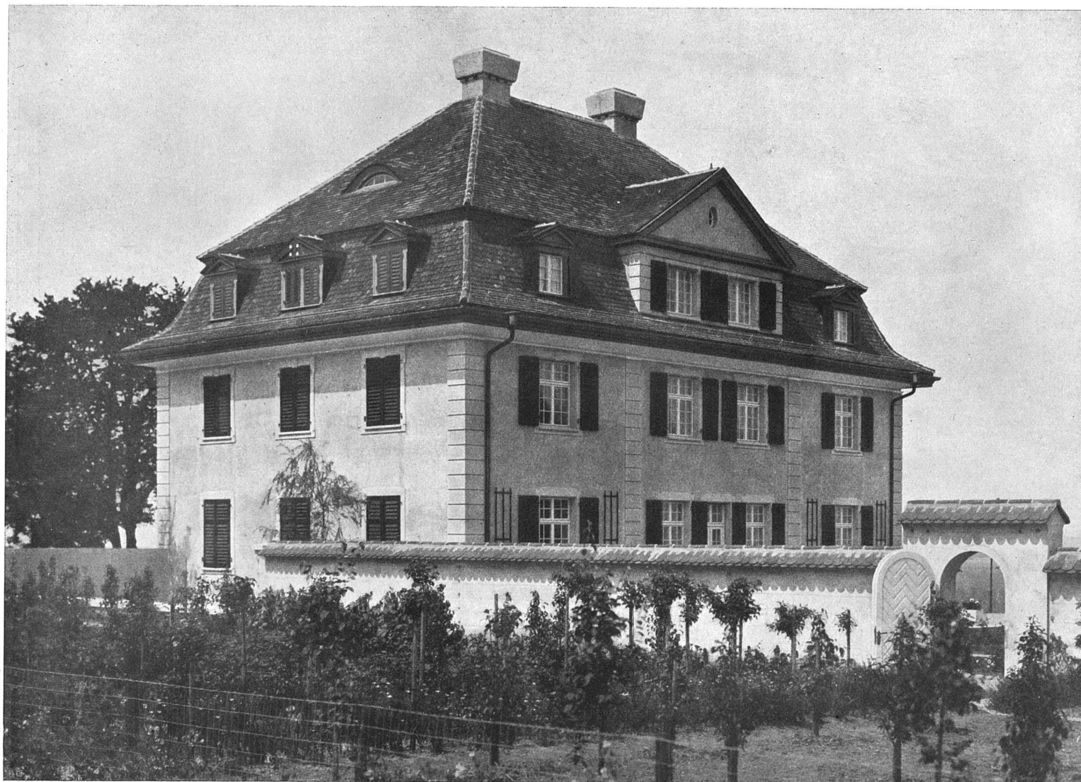
Landhaus bei Tägerwilen :: am Unter-See (Kt. Thurgau)