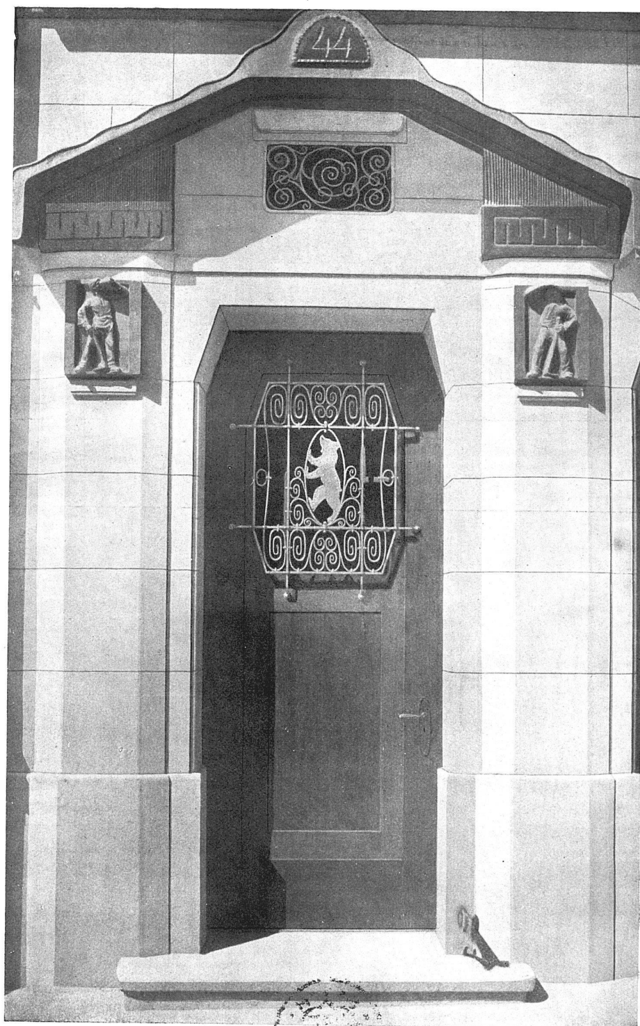
Eingang an der Neugasse

Bronzereliefs von Bildhauer Hermann Hubacher in Bern. Schmiedeeiserne Türfüllung von E. Niederhäuser & Cie. in Bern