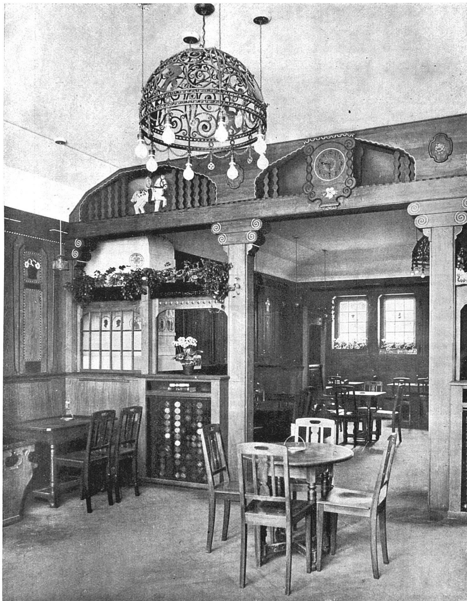
Gaststube im Erdgeschoß