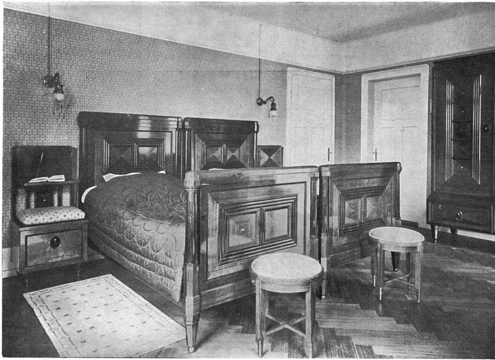
Blick in das Schlafzimmer