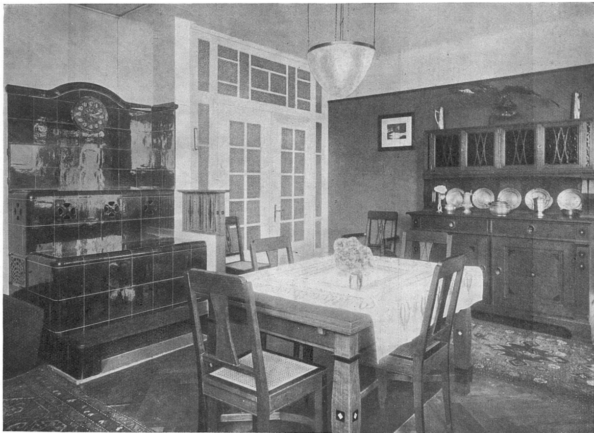
Blick in das Speisezimmer

Wohnhaus von Dr. Schaad in Herzogenbuchsee. Architekten Hägeli in Herzogenbuchsee und E. Kupper in Basel