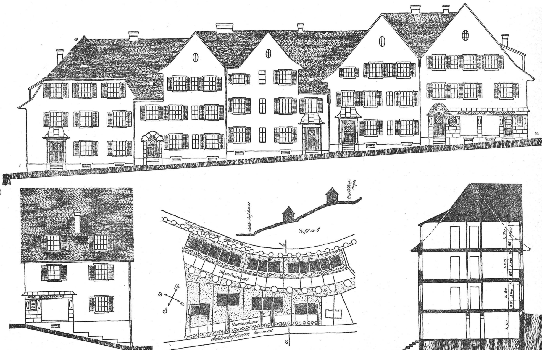
Zur Ueberbauung des Brühlbergareals in Winterthur — Architekten B. S. A. Fritschi & Jangerl in Winterthur Geometrische Ansicht — Ansichten und Querschnitt der Fünfhäusergruppe 1:200 — Lageplan und Querprofil 1:2000