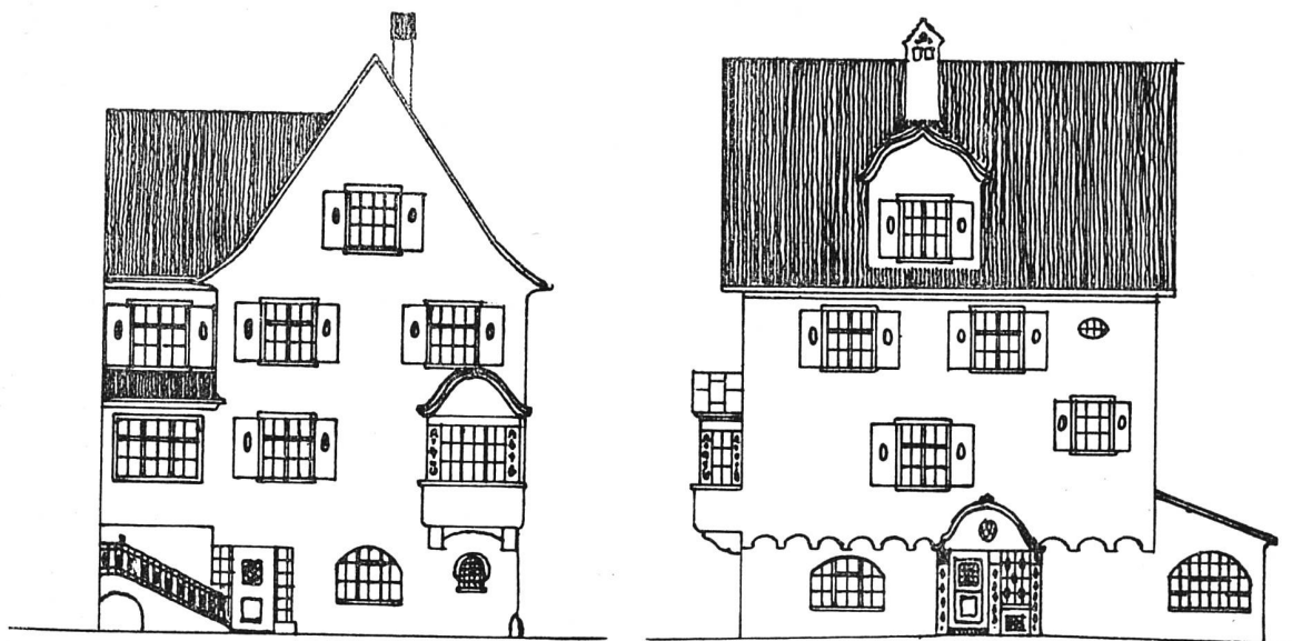
Fassaden. — Maßstab 1:200 Wohnhaus-Um- und Anbau in Chur. — Architekt Willy in Chur.