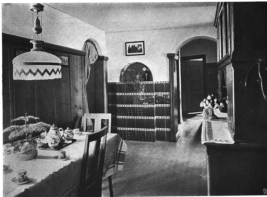
Blick in die Wohnstube

Wohnhaus-Umriss und Anbau in Chur von Architekt J. Willy in Chur