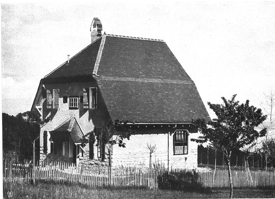
Ein Landhaus in Montmollin (Jura). Architekt (B. S. A.) René Chapallaz in Chaux-de-Fonds