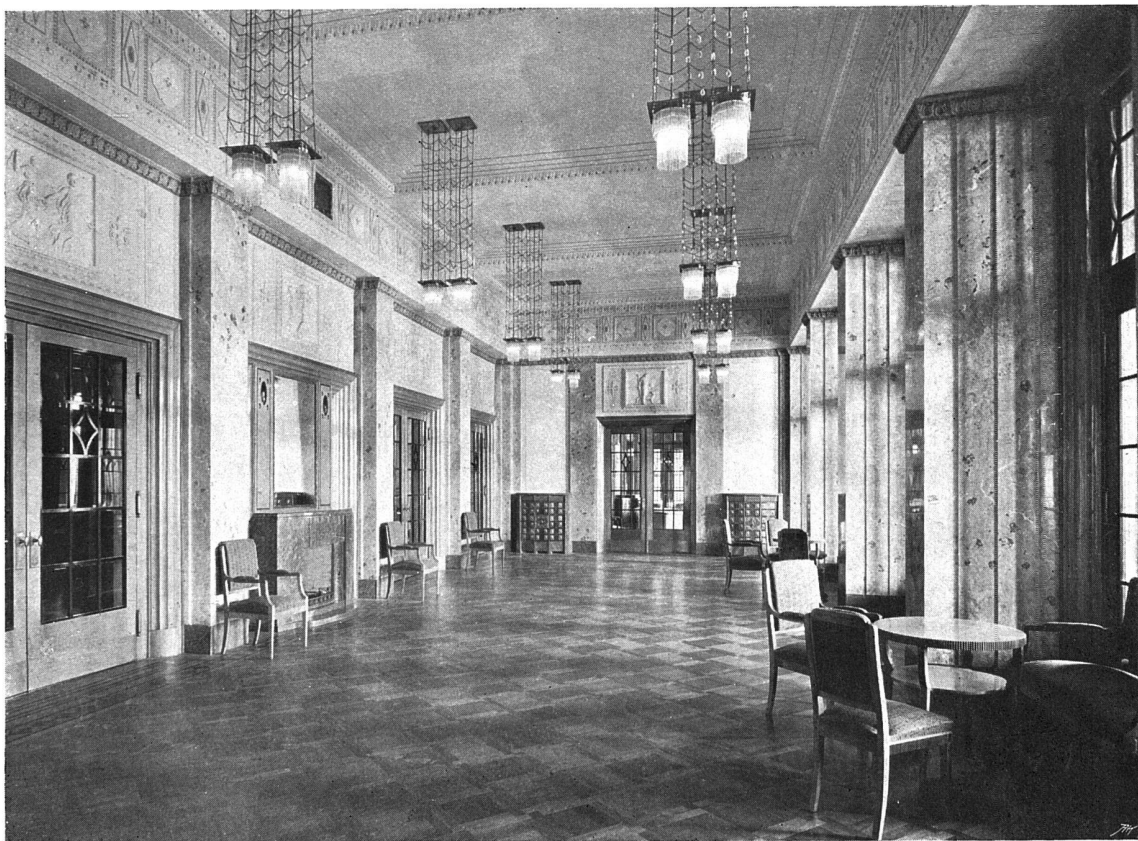
Festsaal: Holzwerk in Ahorn, silbergrau, ausgeführt durch die Firma J. Keller, Zürich. — Marmor vert moderne und graurötlich. Decke und Frieße geschwammt

Hotel Montana in Luzern. — Architekt (B. S. A.) Alfred Möri, Luzern. Mitarbeiter Architekt (B. S. A.) Friedrich Krebs.