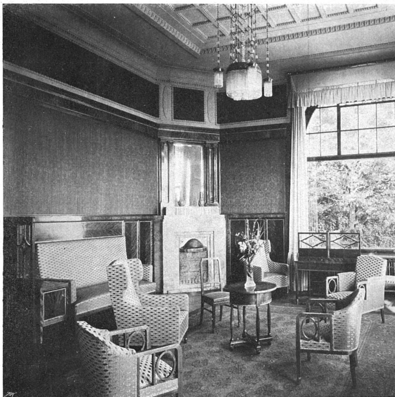
Damenjalon: Ausgeführt durch die Firma Th. Sinnen, Zürich. — Holzwerk: Birken, hell, Wandbehangung grüngelb, Möbelbezüge cremefarbig, Kamin in jaune du vert