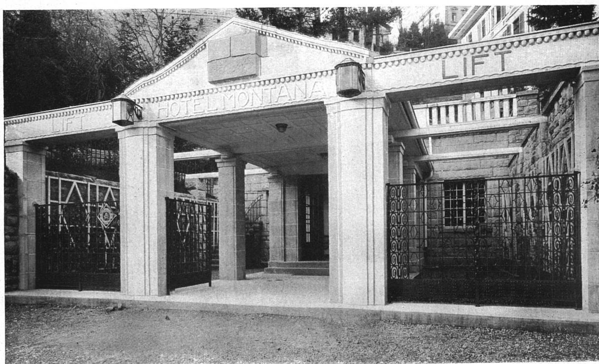
Portal an der Halbestraße

Hotel Montana in Luzern. — Architekt (B. S. A.) Alfred Möri, Luzern. — Mitarbeiter Architekt (B. S. A.) Friedrich Krebs