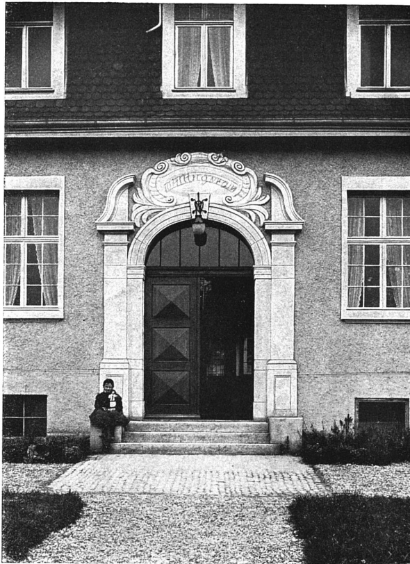
Hauptportal an der Nord-Ost-Fassade