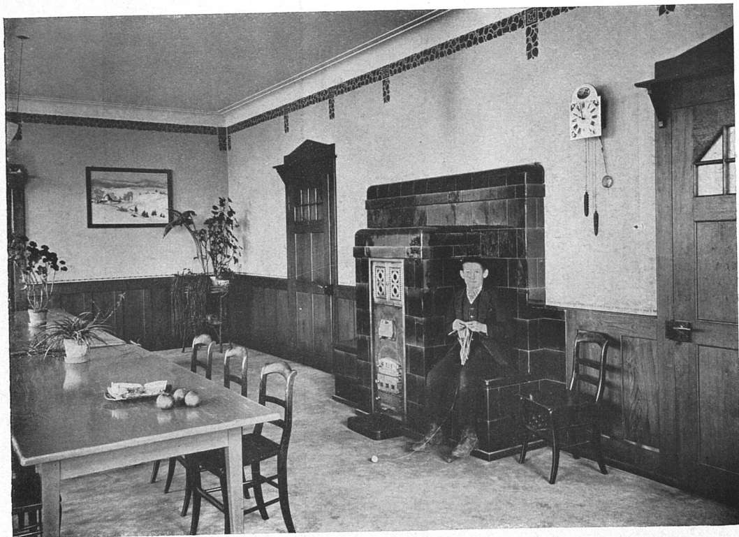
Blick in den Speisesaal

Die Erziehungsanstalt Schillingrain bei Liestal. — Architekt W. Brodtbeck in Liestal