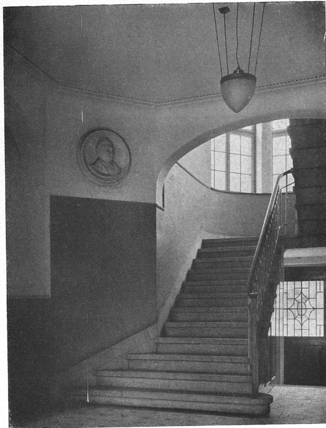
Blick in das Treppehaus