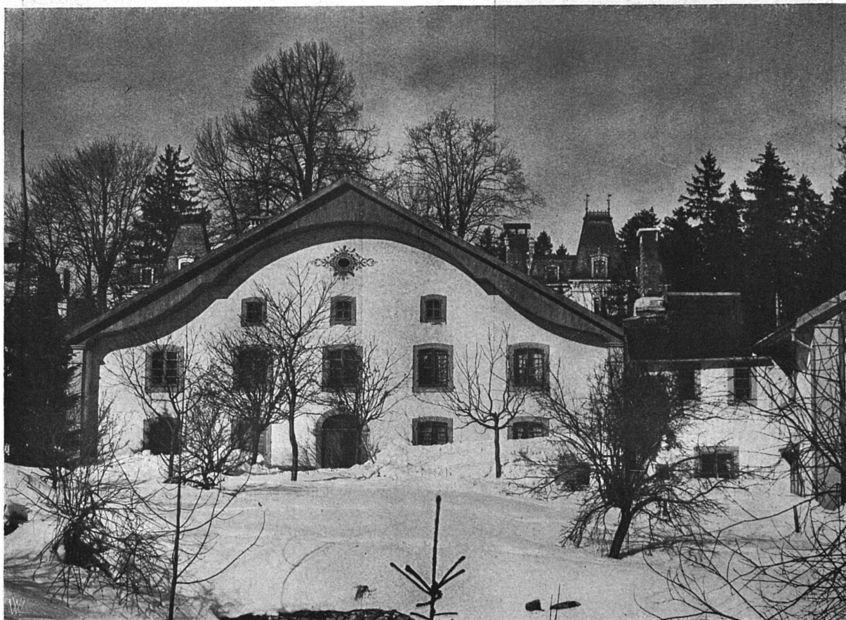
Altes Haus aus Chaux-de-Fonds

Von jurassischen Bauernhäusern. — Aufnahmen von René Chapallaz, Arch. B. S. A., Chaux-de-Fonds