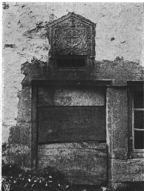
Türdetail aus den Freibergen