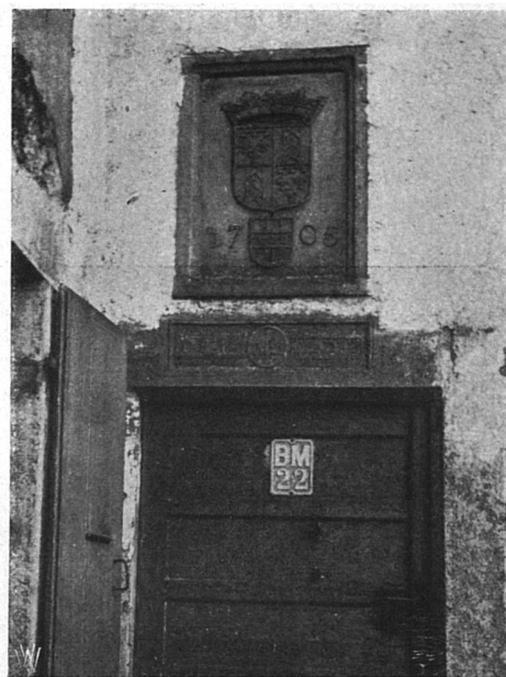
Türdetail aus den Freibergen