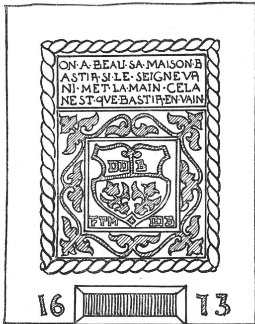
Abb. 2. Inschrifttafel aus dem Neuenburger Jura

Nun einiges über die Hausprüche. Wo so ein sinniger Spruch über der Haustür steht, wird einem gleich warm und wohllich und gerne gibt jeder dem Gedanken Raum, daß in solchem Hause gute Menschen wohnen müssen. Beim Jurahaus ist die Inschrift meist an den Sopraporten angebracht. Eng zusammengedrängt, in römischen