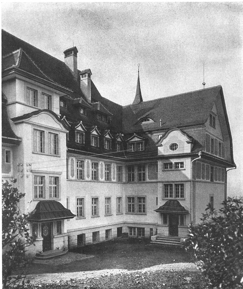
Ansicht der Nordfassade

Das Nervenanstaltium „Franziskusheim“ in Oberwil bei Zug