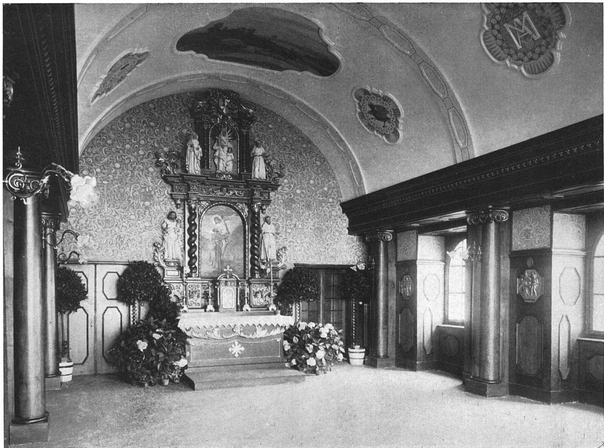
Die Anstaltskapelle