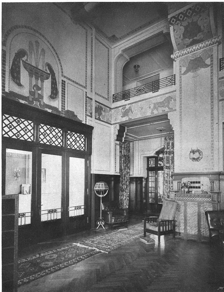
Wände und Decke mit ornamentalen Malereien geziert; Holzwerk in Eichen geräuchert und gewichst; Geminée in Stein mit Kachelinlagen. Bezüge der Sitzmöbel in Moquette, Tapissierestoff und Leder. Beleuchtungskörper und sonstige Metallarbeiten in Alt-Messing getrieben.