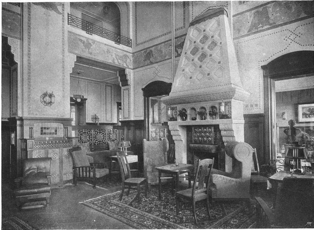
Die Halle: Wand und Decke bemalt. Cheminée Stein mit Kacheln; Holzwerk in Eichen geräuchert und gewichst. Stilmöbelbezüge in Moquette, Tapissierstoff und Leder