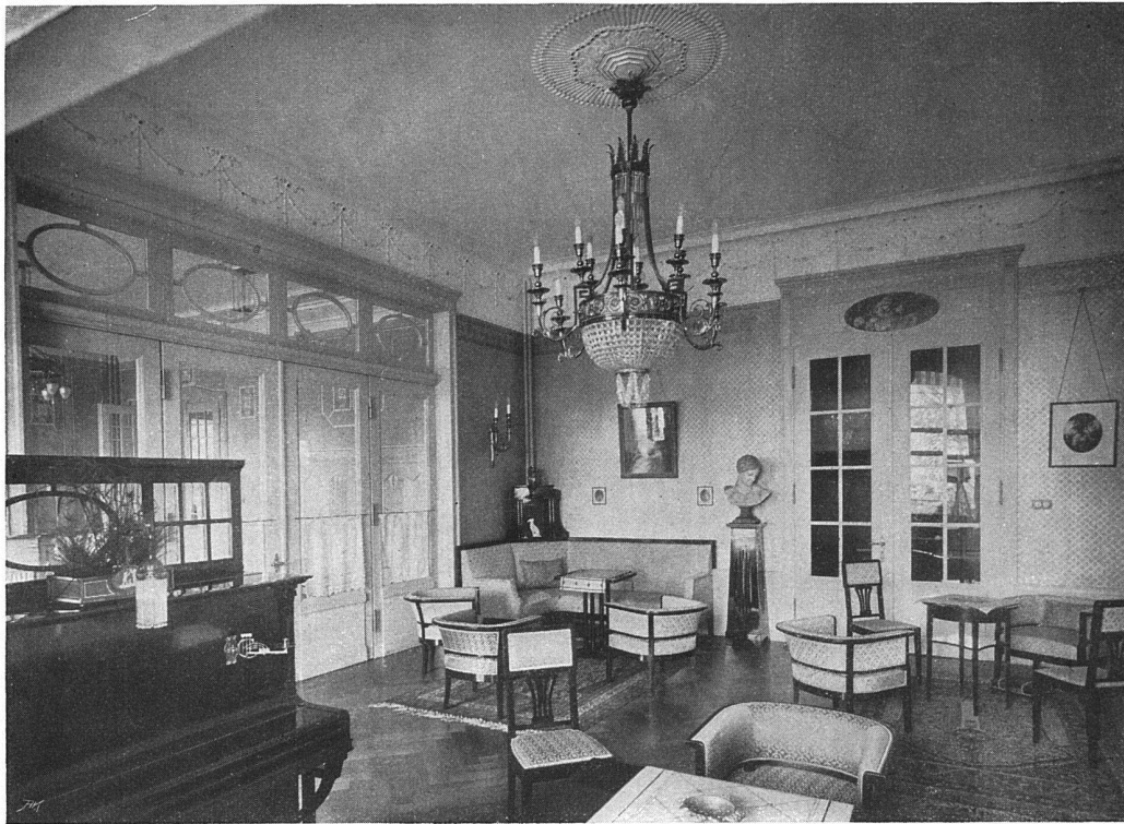
Der Salon: Holzwerk elfenbeinfarbig lackiert; freistehende Möbel in poliertem Mahagoni mit Seidenstoffbezügen; Beleuchtungskörper und Metallarbeiten in Bronze