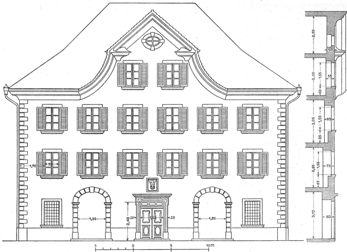
Geometrische Ansicht der Hauptfassade mit Schnitt. — Maßstab 1:150. — Die Fassade ist zur Zeit im Erdgeschoß umgebaut, hier aber nach alten Angaben im ursprünglichen Zustand gezeichnet