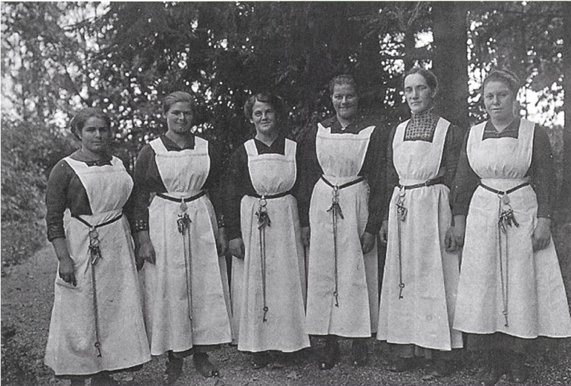
Abb. 2: Zur Berufskleidung des Wartpersonals gehörte bis in die Mitte des 20. Jahrhunderts auch in der Klinik Breitenau der am Gürtel getragene Schlüsselbund. Foto um 1920/30. Privataarchiv Schaffhausen.

schliessen, dass offensichtlich auch in anderen Zusammenhängen Zwang im Spiel war, dieser jedoch nicht – oder zumindest nicht explizit – thematisiert wurde.