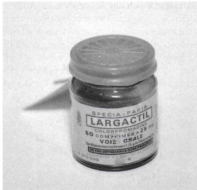
Abb. 3: Das Neuroleptikum Chlorpromazin, ab 1953 unter dem schweizerischen Handelsnamen Largactil auf dem Markt, stand am Beginn der modernen Psychopharmaka. Um 1955, Kantonale Denkmalpflege Zürich, Psychiatrische Universitätsklinik Zürich, Inventar der Kulturgüter 2001.

Moser verantwortlich zeichnete. Moser leitete die Breitenau von 1935 bis 1953, hatte jedoch schon vor dieser Zeit dort gearbeitet. Der Begriff der «chemischen Zwangsjacke» zeigt, dass Moser Beruhigungsmittel nicht als Ersatz von Zwang verstand, sondern als dessen Fortsetzung. Er war nicht der Einzige, der diese Position vertrat; Auguste Forel hatte schon Mitte des 19. Jahrhunderts von «chemischen Zwangsmitteln» gesprochen. 18 Ungewöhnlich ist allerdings, dass sich der Begriff in einem öffentlichen Rechenschaftsbericht von 1935 findet – zu einem Zeitpunkt, als Zwangsmassnahmen endgültig als Indikator für Rückschrittlichkeit galten.