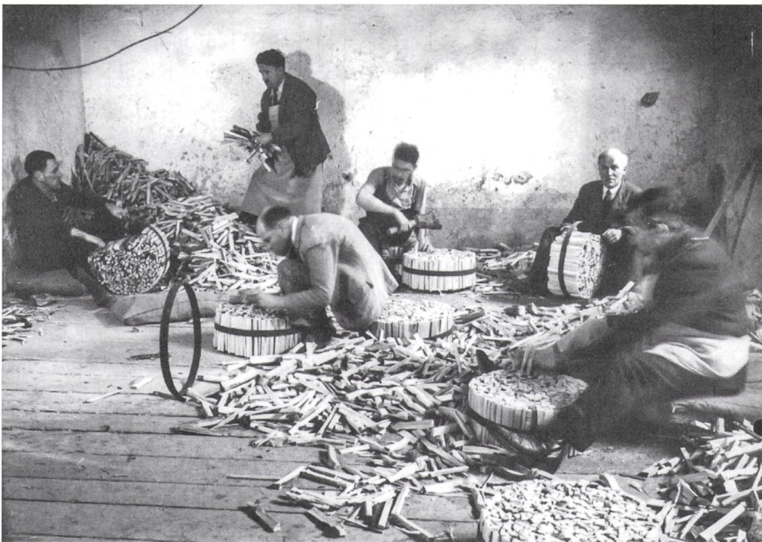
Abb. 4a, b: Die Hausordnung der Breitenau von 1912 hielt fest, dass Patientinnen und Patienten ihren Kräften und Anlagen gemäss zu beschäftigen seien, allerdings ausschliesslich im Interesse der Kranken und der Anstalt. Die Aufnahmen zeigen Patientinnen in der Küche des Burghölzli, Zürich, und Patienten beim Bündeln von Brennholz. Um 1940, Psychiatrische Universitätsklinik Zürich, Sammlung Burghölzli, Bildarchiv.