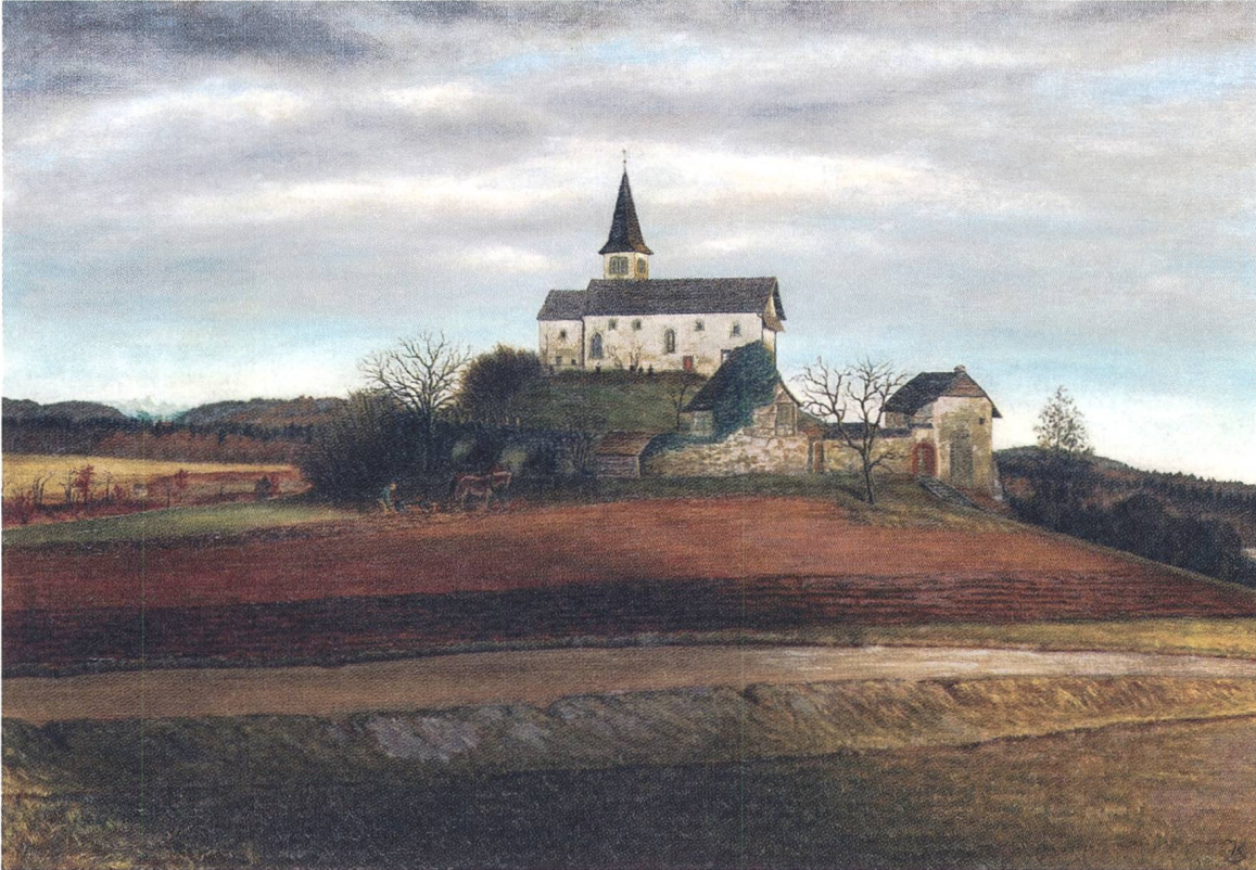
Abb. 3: Karl Lang, Die Bergkirche Büsingen von Norden , Öl auf Leinwand, um 1930. Karl Lang soll das Bild gemalt haben, als er sich um die Aufnahme in die Badische Hochschule für Bildende Künste in Karlsruhe bewarb.

dabei allerdings auf Aussagen aus der Gemeinde, die der Kirche einen desolaten baulichen Zustand bescheinigten. 3 Die Gemeinde legte dar, dass es keine Mittel, weder von ihrer noch von kirchlicher Seite gebe, um eine Renovierung zu finanzieren, und Anträge zwecks Unterstützung sollten an das Badische Kultusministerium gestellt werden. Diese Anträge wurden 1930 abschlägig beschieden. 4 Auf Ersuchen des evangelischen Pfarramts wurde 1933 die Empore der Kirche auf ihre Festigkeit geprüft und als «beschränkt nutzbar» eingestuft. 5 Als dringend notwendig wurde einzig die Instandsetzung des Dachs erkannt. Allerdings fehlten wieder die finanziellen Mittel, da die Bewilligung eines Reichszuschusses abgelehnt wurde. Für die Kirchgemeinde Büsingen waren diese Entscheidungen nicht akzeptabel, und der