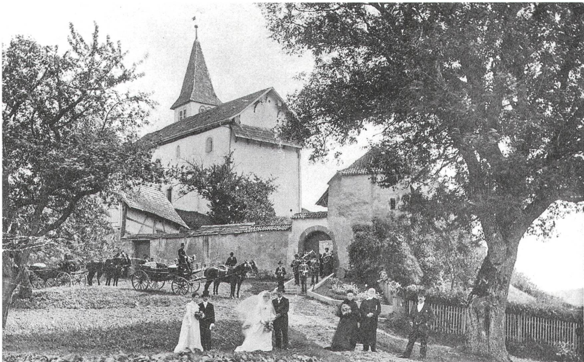
Abb. 2: Hochzeitsgesellschaft vor dem Aufgang zur Bergkirche, Fotograf unbekannt, Anfang 20. Jahrhundert. Der 1740 erstmals erwähnte Nussbaum vorne rechts soll am 17. November 1932 gefällt worden sein.