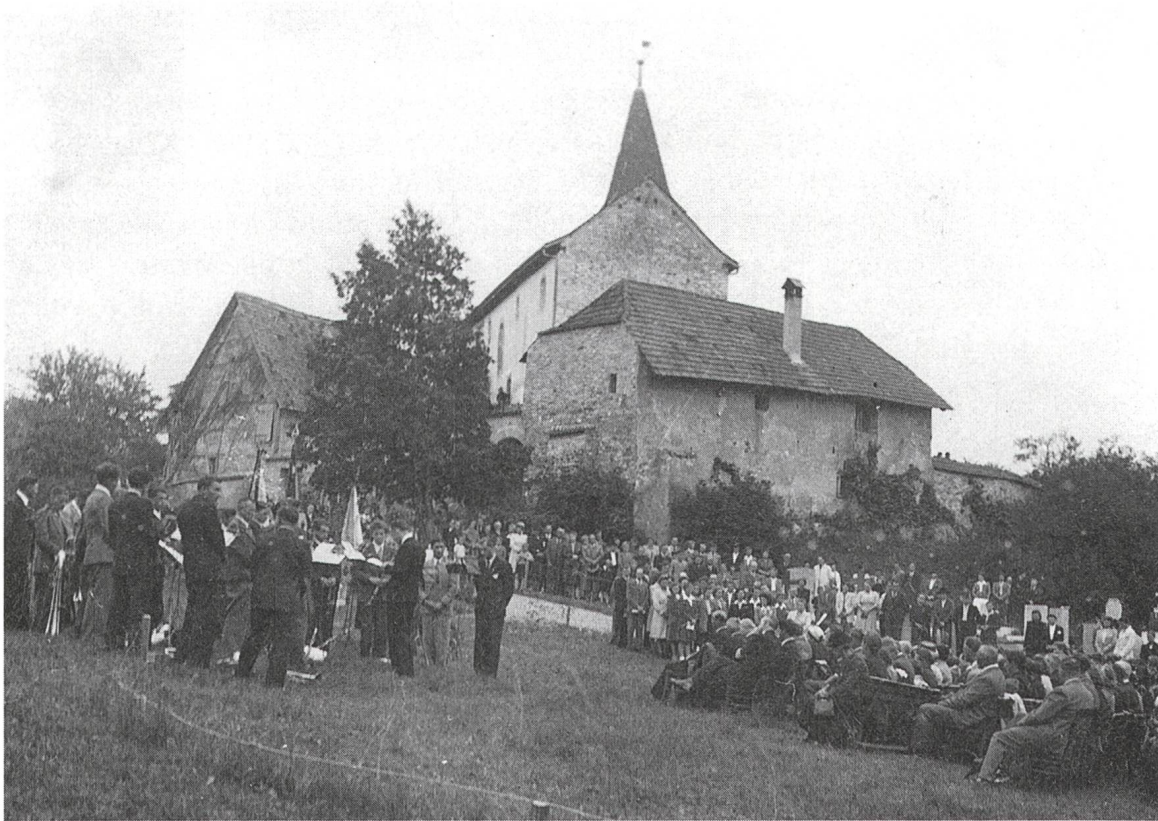
Abb. 4: Friedhofeinweihung und Bergkirchenfest, 25. Juli 1948, Fotograf unbekannt.

neuen Friedhofsteils, intensivierten das Interesse der Büsinger Einwohnerschaft an den Problemen der Bergkirche wieder. Sowohl der Kirchgemeinderat als auch der politische Gemeinderat erkannten die unaufschiebbare Notwendigkeit, den infolge der Witterungseinflüsse schnell fortschreitenden Zerfall der alten Kirche mit geeigneten Massnahmen aufzuhalten. Besondere Schwierigkeiten bereitete das finanzielle Problem. Eine Hilfe von Seiten der Badischen Landeskirche kam aufgrund der Nachkriegsnot in Deutschland und der komplizierten Währungsverhältnisse von vornherein nicht infrage. Ebenso wenig verfügte die Kirchgemeinde über Geldmittel, die sie dafür zur Verfügung stellen konnte. Auf Initiative des Kirchenältesten, des Lehrers und Organisten Hugo Eckert (1903–1974), 12 wurde im April 1948 in Büsingen eine Haussammlung zugunsten des Instandsetzungsprojekts durchgeführt. Das Gesamtergebnis dieser Sammlung belief sich auf 2600 Franken. Dieser Betrag reichte bei Weitem nicht aus, um die bereits 1939 kalkulierten weiteren Kosten von 3500 Reichsmark (ohne Architektenhonorar) zu decken. 13 Am 25. Juli 1948 wurden die Rückkehr der Glocken und die Weihe des neuen Friedhofs feierlich