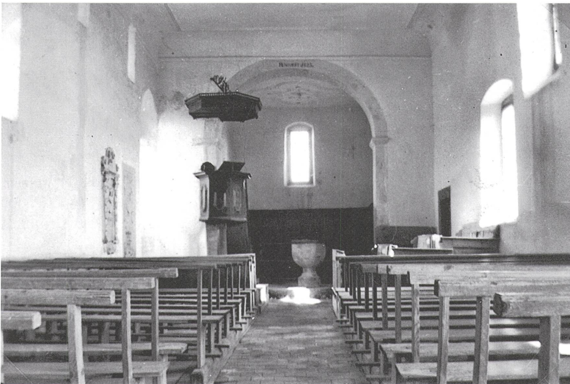
Abb. 7: Das Innere der Kirche, Blick zum Chor, vor Entfernung des Schalldeckels der Kanzel.