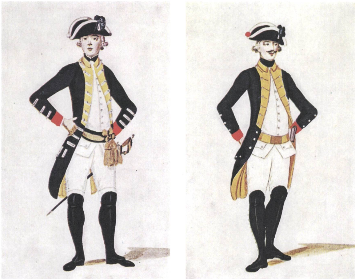
Abb. 4: Offizier (links) und Soldat des Regiments Peyer im Hof nach der Handschrift 102 in der Biblioteca Reale in Turin zur Zeit der Kapitulation 1793. Der Soldat trägt das braune Lederzeug der alten Ordonnanz.

Die Uniform 82 bestand gemäss der üblichen Ordonnanz in Sardinien-Piemont auch für das Regiment Peyer im Hof gemäss der Kapitulation (Artikel 39) aus dem schwarzen Dreispitz mit der dunkelblauen Kokarde, dem blauen Rock, der weissen Weste und der weissen Hose. Dazu kamen speziell für Peyers Regiment im Unterschied zu den anderen Truppenkörpern ein weisser Galon am Hut, weisse Knöpfe, in Gelb Brustklappen, Kragen und Futter, rote Ärmelumschläge und eine schwarze Halsbinde beziehungsweise Krawatte. Die in der Kapitulation beschriebene Zusammensetzung wurde jedoch nicht umgesetzt, sondern die Farben von Ärmelrevers und Brustklappen wurden vertauscht. Die Grenadiere trugen die vorne hochgezogene Fellmütze. 83 Diese war mit einem Metallschild verziert, welches das Wappen von Savoyen unter der Krone und von Fahnen und Eichenlaub umgeben zeigt. Im Felddienst wurde der übliche Dreispitz getragen. Die Grenadiere zeichnete, damit sie von den Füsiliern zu unterscheiden waren, eine weisse, gewellte Borte auf dem Revers aus.