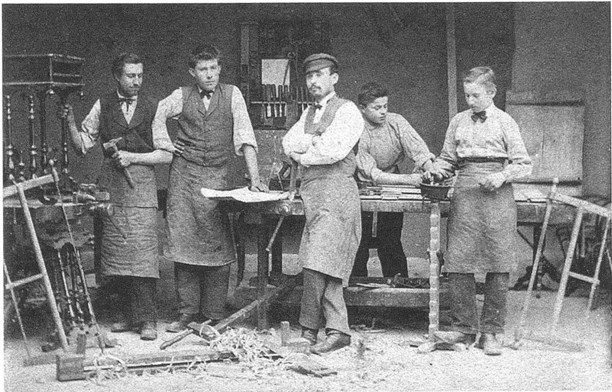
Schon früh kümmerte sich die GGS um die Berufsbildung. Blick in eine Schreinerei, um 1885.