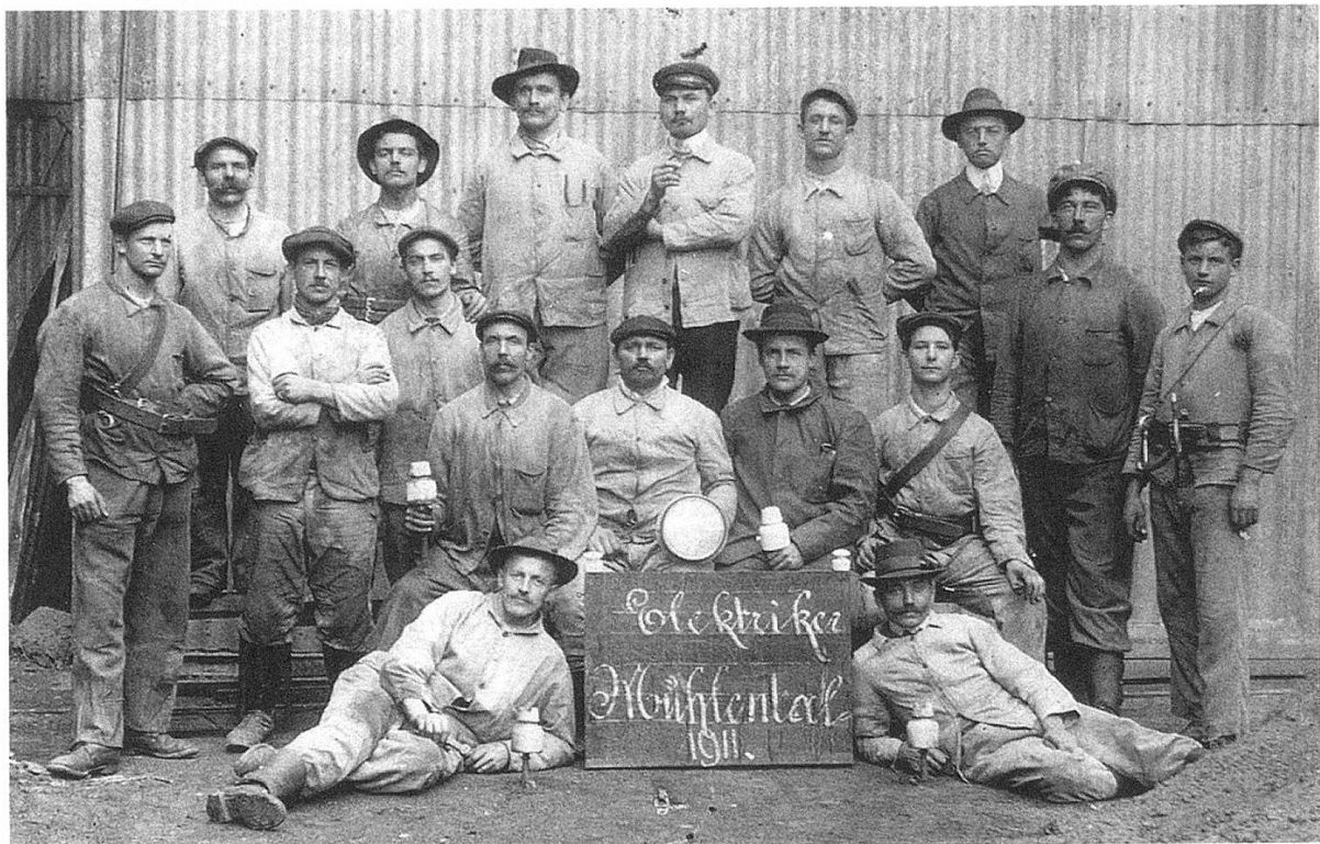
Elektriker wurde im Zuge der Elektrifizierung um die Jahrhundertwende zum «Modeberuf».