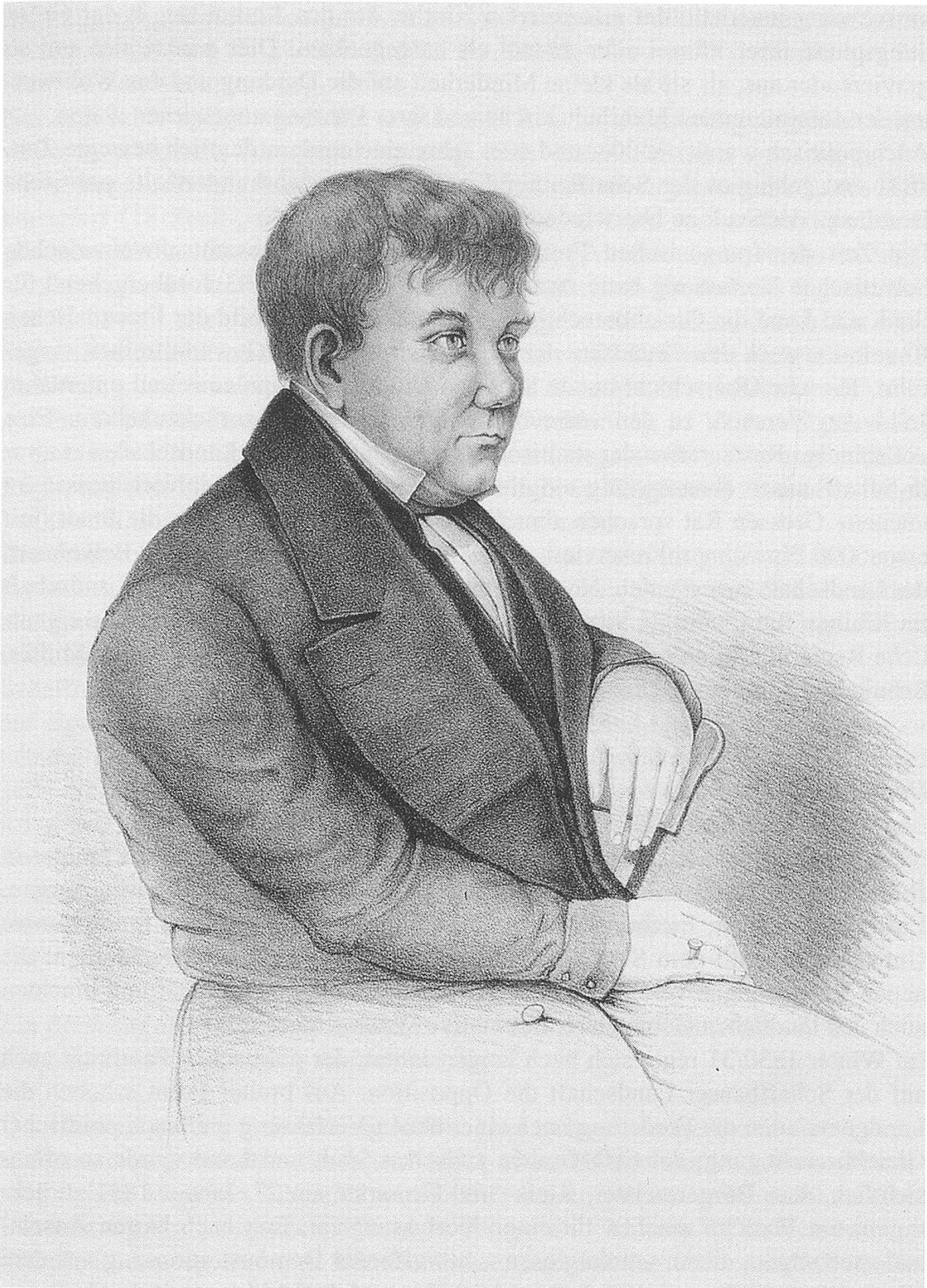
Friedrich Emanuel Hurter (1787–1865), Antistes zur Zeit der Diskussion um die Zulassung katholischer Gottesdienste in der Stadt Schaffhausen, 1844 Übertritt zur katholischen Kirche und Reichshistoriograph in österreichischen Diensten.