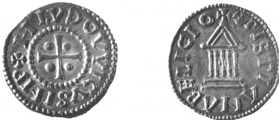
Abb. 4. Karolinger. Ludwig der Fromme (814–840), Denar. Museum zu Allerheiligen, Schaffhausen.

Zwischen 670 und 680 findet im Frankenreich ein allmählicher Übergang von der Gold- zur Silberprägung statt. Verschiedene germanische Ethnien, darunter auch die Alamannen, werden zu dieser Zeit praktisch selbständig. Erst unter Karl Martell, kurz vor der Mitte des 8. Jahrhunderts, können sie wieder fester mit dem Reich verbunden werden. Im Jahr 751, als der Karolinger Pippin (751–768) den letzten Merowingerkönig mit päpstlichem Segen in ein Kloster verweist, unternimmt Pippin auch eine Münzreform. Sozusagen allein gültiges Zahlungsmittel wird der silberne karolingische Denar. Das Münzrecht wird wieder zentralisiert, Gewicht und Erscheinungsbild der Münzen werden vereinheitlicht.