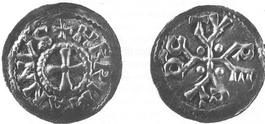
Abb. 5. Herzogtum Schwaben. Hermann I. (926–949), Denar, Zürich. Schweizerisches Landesmuseum, Zürich.

Die Bedeutung Zürichs wird noch dadurch unterstrichen, dass im ganzen Herzogtum nur noch eine zweite herzogliche Münzstätte betrieben wird, nämlich in Breisach.