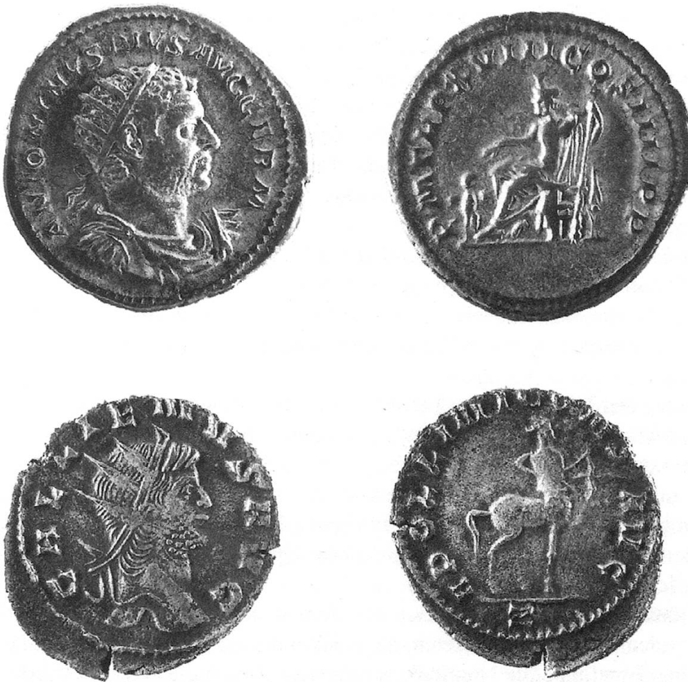
Abb. 2. Römisches Reich. 1: Kaiser Caracalla (211–217), Antoninian, Rom. 2: Kaiser Gallienus (260–268), Antoninian, Rom. Museum zu Allerheiligen, Schaffhausen.

stammen ca. 470 aus Stein am Rhein, 6 etwa 150 aus Schleithelm, 7 30 aus Osterfingen und die restlichen aus dem übrigen Kantonsgebiet. Diese Fundmünzmenge wird im Kanton erst wieder im Spätmittelalter erreicht. 8