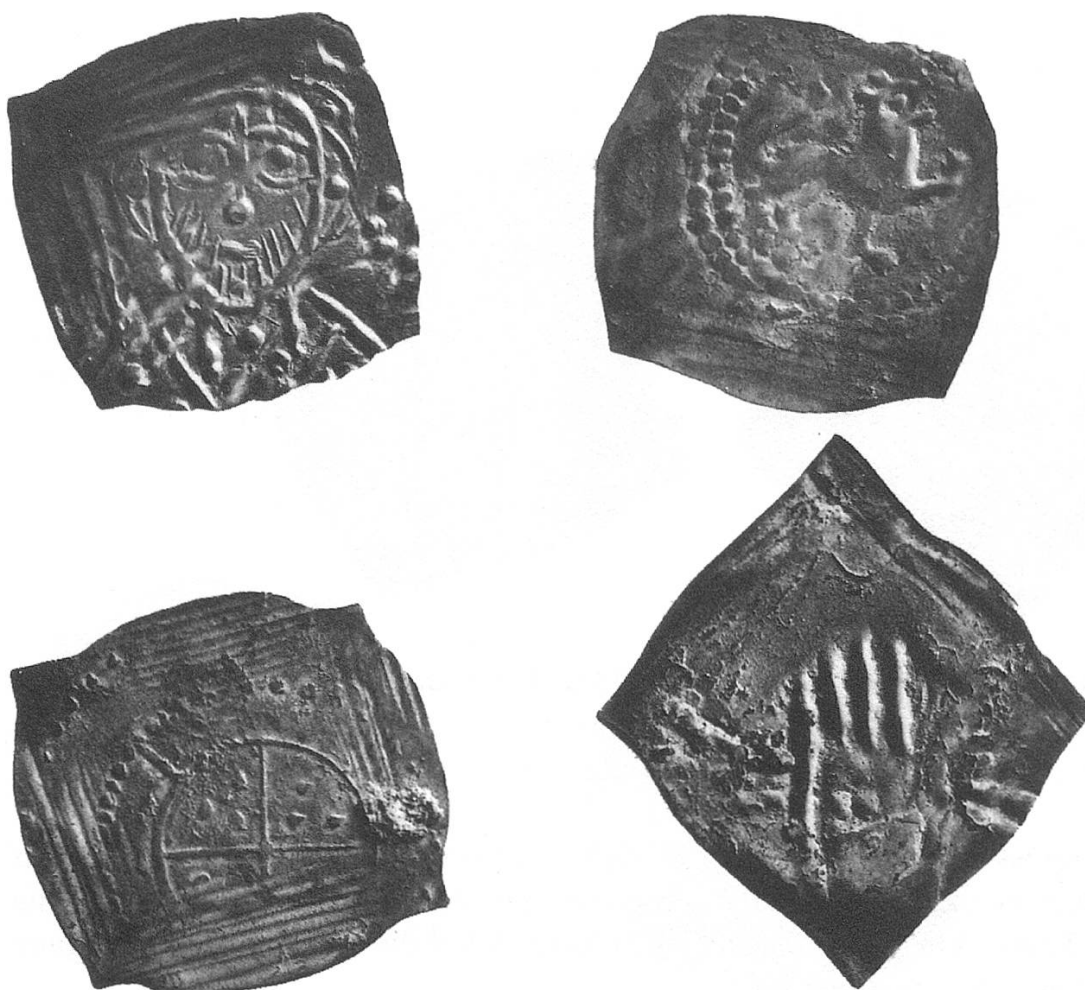
Abb. 10. Anonyme Pfennige (Halbbrakteaten) um 1130, diverse unbestimmte Münzherren und Münzstätten. Alle aus dem Schatzfund von Steckborn. Münzkabinett Winterthur.

1. März 1080 Schaffhausen samt Münzrecht und Markt an das Kloster Allerheiligen übertragen wurde, doch ist auf keinem dieser Exemplare ein Hinweis auf Schaffhausen zu finden. Voraussetzung ist natürlich, dass die Schatzbildung dieses Steckborner Fundes wirklich erst in die Anfänge des 12. Jahrhunderts fällt. Sollte sich bei den laufenden Untersuchungen 32 herausstellen, dass die ältesten Münzen bereits aus der frühen 2. Hälfte des 11. Jahrhunderts stammen, so könnten auch andere Motive für Schaffhausen in Frage kommen.