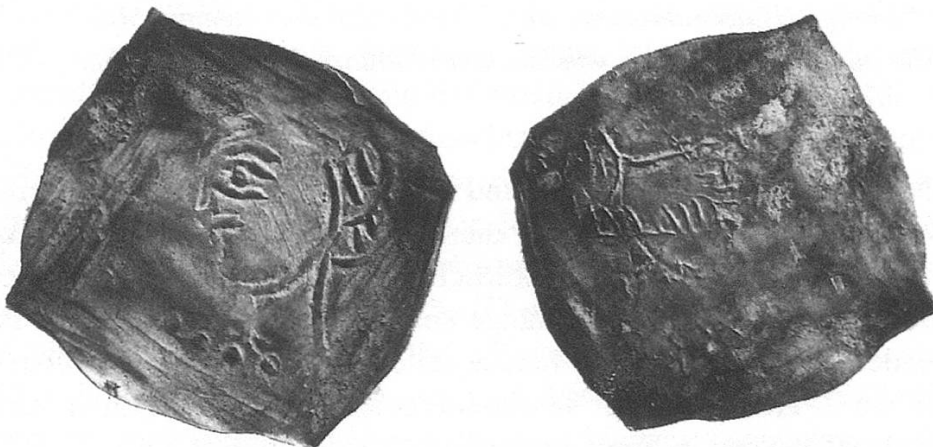
Abb. 9. Abtei St. Gallen. Anonymer Pfennig (Halbbrakteat) um 1130, St. Gallen. Aus dem Schatzfund von Steckborn. Münzkabinett Winterthur.

Die zweitgrösste Gruppe dürfte aus St. Gallen stammen. Diese Münzen tragen auf der Vorderseite das Brustbild eines Abtes en face oder im Profil, auf der Rückseite steht das Lamm, ein Motiv, das bis ins Spätmittelalter die St. Galler Münzprägung kennzeichnet und sogar dominiert.