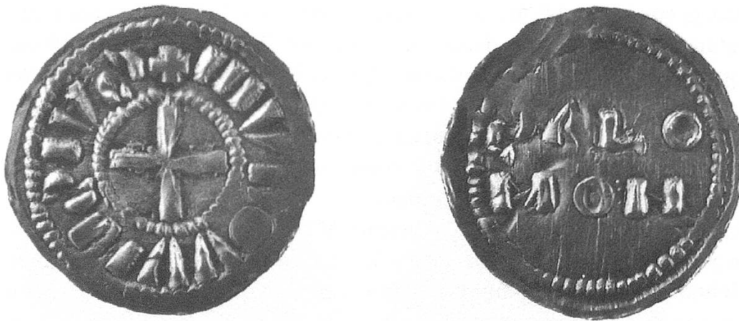
Abb. 6. Karolinger. Ludwig das Kind (899–911), und Bischof Salomon (890–919), Denar, Konstanz. Schweizerisches Landesmuseum, Zürich.

Gemeinschaftsprägung von Kaiser Konrad II. (1027–1039) und Bischof Warmann (1026–1034). Nach Warmann folgen wieder bischöfliche Prägungen ohne königliche oder kaiserliche Beteiligung, so der Bischöfe Eberhard I. (1034–1046), Rumold (1051–1069), Karlmann (1069–1071) und späteren.