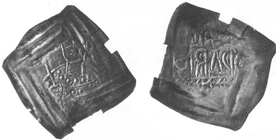
Abb. 8. Bistum Konstanz. Bischof Ulrich I. (1111–1127) oder Ulrich II. (1127–1138), Pfennig (Halbbrakteat), Konstanz. Aus dem Schatzfund von Steckborn. Museum zu Allerheiligen, Schaffhausen.

mauer, oder eher eine Kirchenfassade mit der mehr oder weniger klar lesbaren Aufschrift VORARIC = Ulrich.