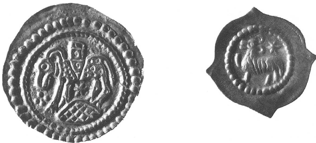
Abb. 12. Abtei Allerheiligen. 1: Pfennig (Brakteat) um 1180/90, Schaffhausen. 2: Pfennig (Brakteat) um 1200, Schaffhausen. Museum zu Allerheiligen, Schaffhausen.