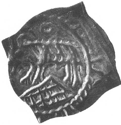
Abb. 11. Abtei Allerheiligen. Pfennig (Brakteat) um 1160, Schaffhausen. Schweizerisches Landesmuseum, Zürich.

Die Zeit von über hundert Jahren zwischen dem Münzurkundedatum und dem Prägen der ersten, eindeutig Schaffhausen zuweisbaren Münze, etwa um 1160, braucht nicht zu erstaunen, sind doch dazu viele Parallelen vorhanden. 33 Das Beispiel von St. Gallen wurde bereits erwähnt, ein weiteres, noch wesentlich aufschlussreicheres ist von Verden bei Bremen anzuführen. Hier verleiht bereits 985 Otto III. das Münzrecht. Dieses wird von allen Saliern bis zu Heinrich IV., 1059, bestätigt, ohne dass eine einzige Münze dieses Ortes aus salischer Zeit bekannt wäre. 34