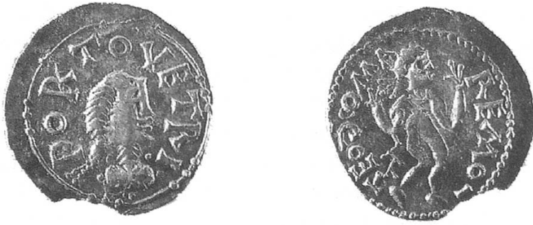
Abb. 3. Merowinger. Triens um 620. Aus dem Schatzfund von Schleithem. Museum zu Allerheiligen, Schaffhausen.

Obwohl in der Schweiz auch merowingische Münzstätten tätig sind – alle liegen westlich der Reuss und konzentrieren sich auf die Südwestschweiz – kann nicht mehr von einer regulären Geldwirtschaft gesprochen werden. 18 Die Nord- und Ostschweiz kehrt zur Naturalwirtschaft zurück.