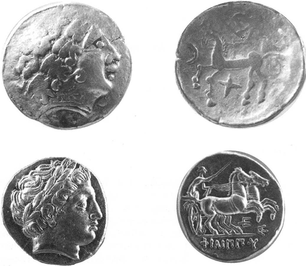
Abb. 1. 1: Helvetischer Goldstater, gefunden bei Schaffhausen. Schweizerisches Landesmuseum, Zürich. 2: Königreich Makedonien. Philippos II. (359–336 v. Chr.), Goldstater. Schaffhauser Privatsammlung.

schwung und die beginnende, relativ lange Friedenszeit spiegeln sich in den Münzfunden deutlich wider.