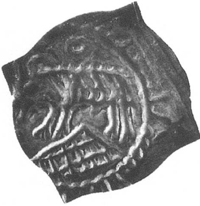
Abb. 11. Abtei Allerheiligen. Pfennig (Brakteat) um 1160, Schaffhausen. Schweizerisches Landesmuseum, Zürich.

Die Zeit von über hundert Jahren zwischen dem Münzurkundedatum und dem Prägen der ersten, eindeutig Schaffhausen zuweisbaren Münze, etwa um 1160, braucht nicht zu erstaunen, sind doch dazu viele Parallelen vorhanden. 33 Das Beispiel von St. Gallen wurde bereits erwähnt, ein weiteres, noch wesentlich aufschlussreicheres ist von Verden bei Bremen anzuführen. Hier verleiht bereits 985 Otto III. das Münzrecht. Dieses wird von allen Saliern bis zu Heinrich IV., 1059, bestätigt, ohne dass eine einzige Münze dieses Ortes aus salischer Zeit bekannt wäre. 34