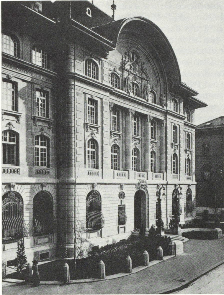
Schweizerische Nationalbank in Bern