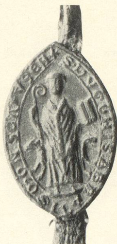
Abb. 3 b Hugo II. 1258