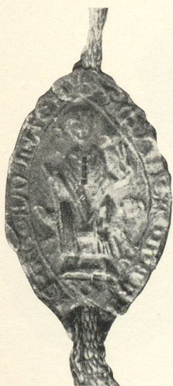
Abb. 4 b Konrad III. v. Henkart 1274