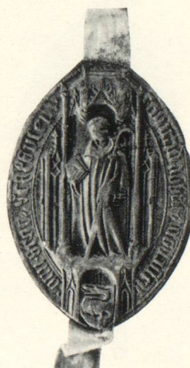
Abb. 16 a Konrad VI. Dettikofer 1488