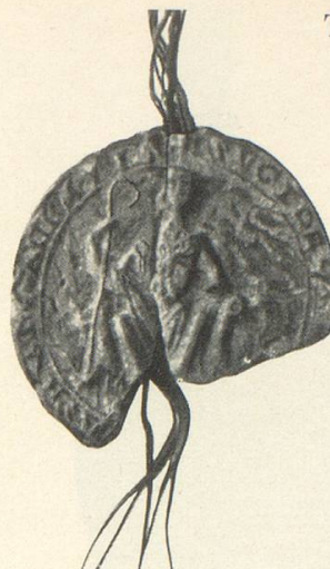
Abb. 3 a Hugo II. 1257