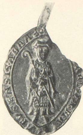
Abb. 2 Burkhard 1220/30