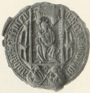
Abb. 16 b Konrad VI. Dettikofer Sekretsiegel, 1468