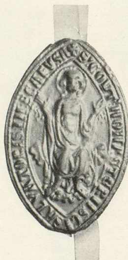
Abb. 19 b Jüngerer Konventsiegel 1504