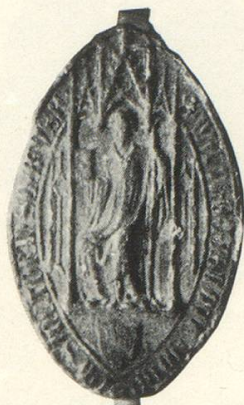
Abb. 12 b Walter v. Seglingen 1384