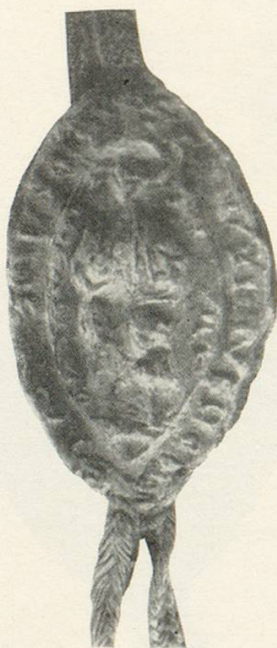
Abb. 19 a Aelteres Konventsiegel 1259