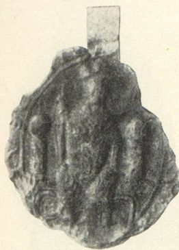
Abb. 1 Rudolf 1198