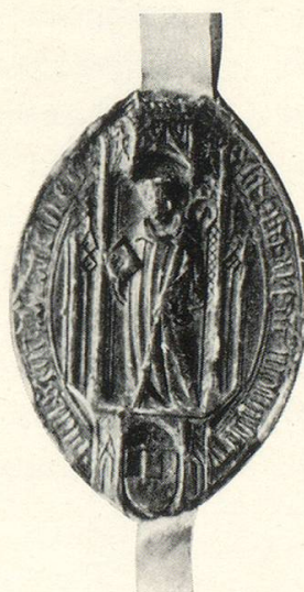
Abb. 15 Berchtold III. Wiechser 1450