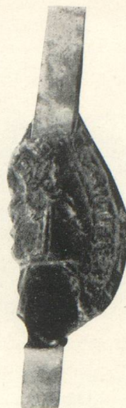
Abb. 13 a Berchtold II. v. Sissach als Prior, 1394