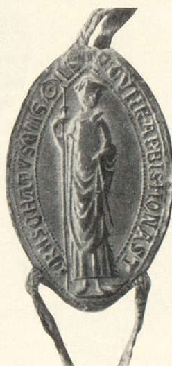
Abb. 6 Konrad IV. v. Liebenfels 1302