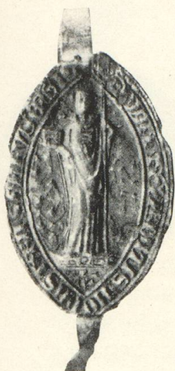
Abb. 12 a Walter v. Seglingen 1376