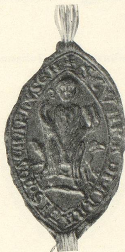
Abb. 4 a Konrad III. v. Henkart 1259