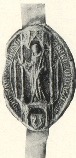
Abb. 13 b Berchtold II. v. Sissach 1414