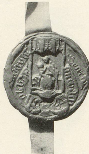
Abb. 18 b Michael Eggenstorfer Sekretsiegel, 1518