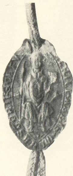
Abb. 5 Ulrich II. v. Immendingen 1296