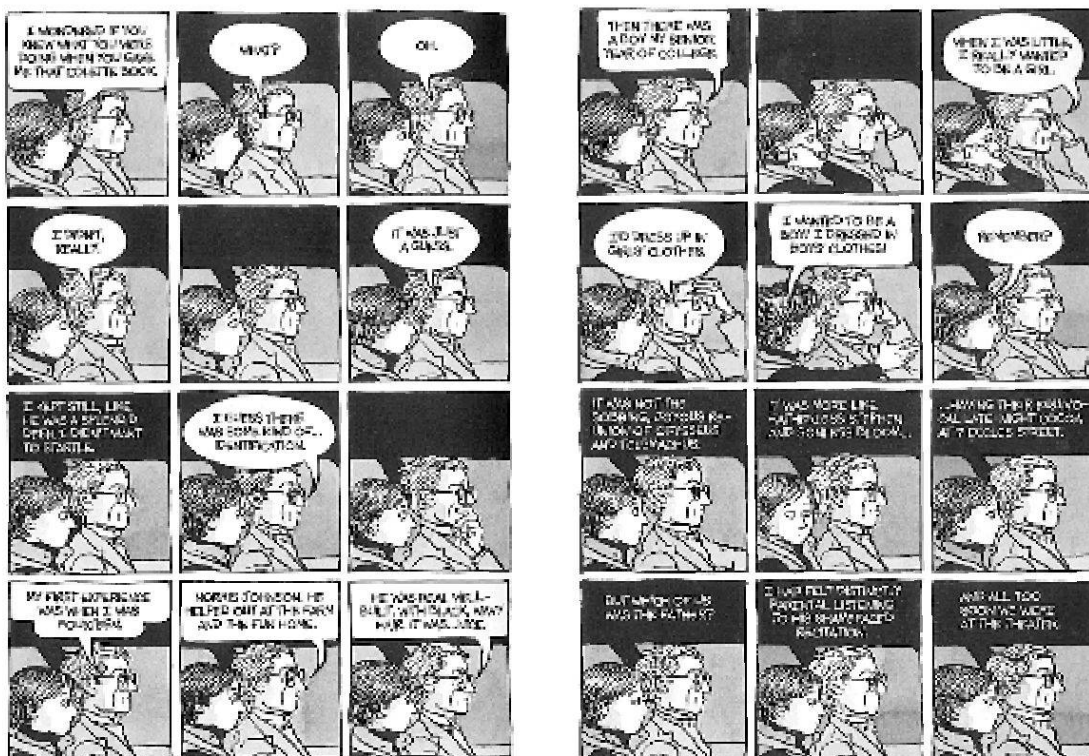
Illustration from Fun Home by Alison Bechdel.