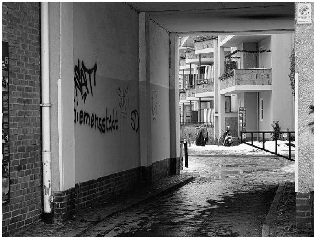
Abb. 2: Eingang zum Haus von Diana, einer 29-jährigen Einwanderin aus der Ukraine

Jedes Mal, wenn Diana den Weg zu ihrer Wohnung durchschreitet, kann sie sich ihres Jüdischseins rückversichern, indem sie buchstäblich in die Architektur ihres eigenen Hauses eintaucht. Eine physische Erfahrung eigener Identität wird hier durch die materielle Stadtstruktur möglich. (Vgl. Abb. 2)