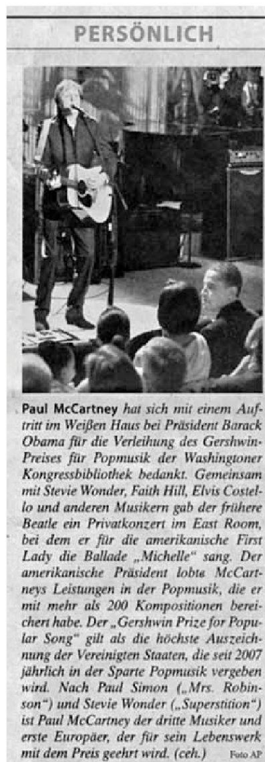
«FAZ», 4.6.10, S. 8

Wie wenig die «20 Minuten» auf einen Hau-Drauf-Stil gepolt ist, zeigt übrigens der Text über Lady Gaga. Wie die «FAZ» berichtet auch das Gratisblatt über Lady Gagas Erkrankung und zwar genauso sachlich. Der Leser wird im Boulevardblatt gefordert, verschiedene Stillagen neben- und miteinander zu realisieren. Nur das Bild und seine Unterschrift geben dem Sachtext einen zusätzlichen Kick mit der vieldeutig zu beziehenden Anspielung: «Grenzwertig positiv: Lady Gaga».