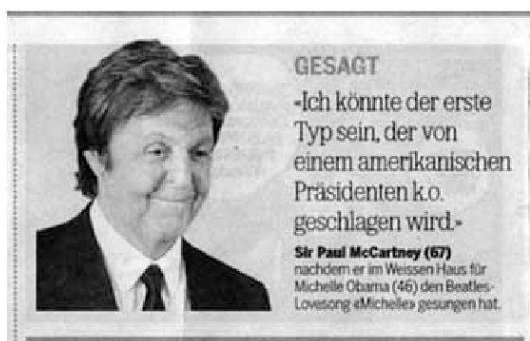
«20 Minuten», 4.6.10, S. 19