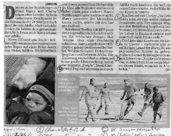
«Hamburger Morgenpost», 22.6.10, S. 64