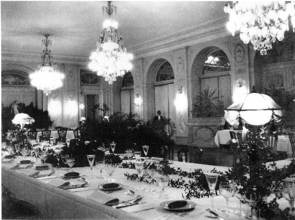
Abb. 2: Festlich gedeckte Tafel für eine Abendgesellschaft, wahrscheinlich in einem Basler Privathaus.

legte ein Anstandsbuch von 1891 im Zusammenhang mit der Erörterung der Regeln der Geselligkeit gar die expliziten Worte in den Mund: „... ich habe mich noch nicht ganz an den Gedanken gewöhnt, als Frau eines hohen Staatsbeamten einen Teil seines Amtes mit zu erledigen – also selbst eine offizielle Persönlichkeit zu sein.“ 24