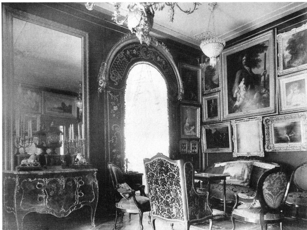
Abb. 3: Salon eines Basler Privathauses. Bild: A. Teichmann, um 1880 (Sammlung Herzog, Basel).

lich-privaten Doppelcharakter verlieh, der im Kern jeder bürgerlichen Vergesellschaftung stand.